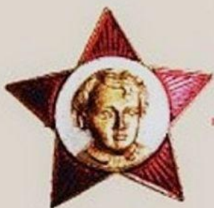
Октябренок Школьники с 7 до 9 лет.