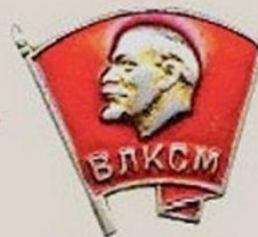
Комсомолец Молодежь с 14 до 28 лет.