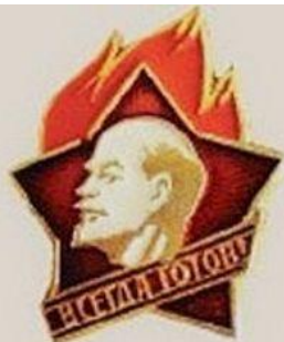
Пионер Школьники с 9 до 14 лет.