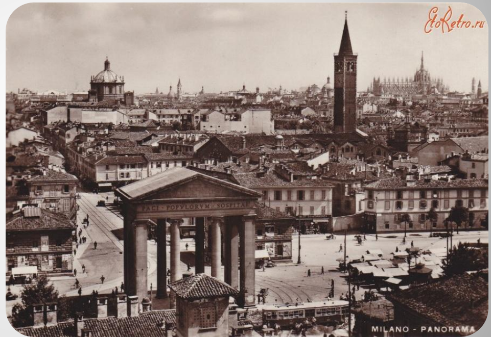
MILANO - PANORAMA