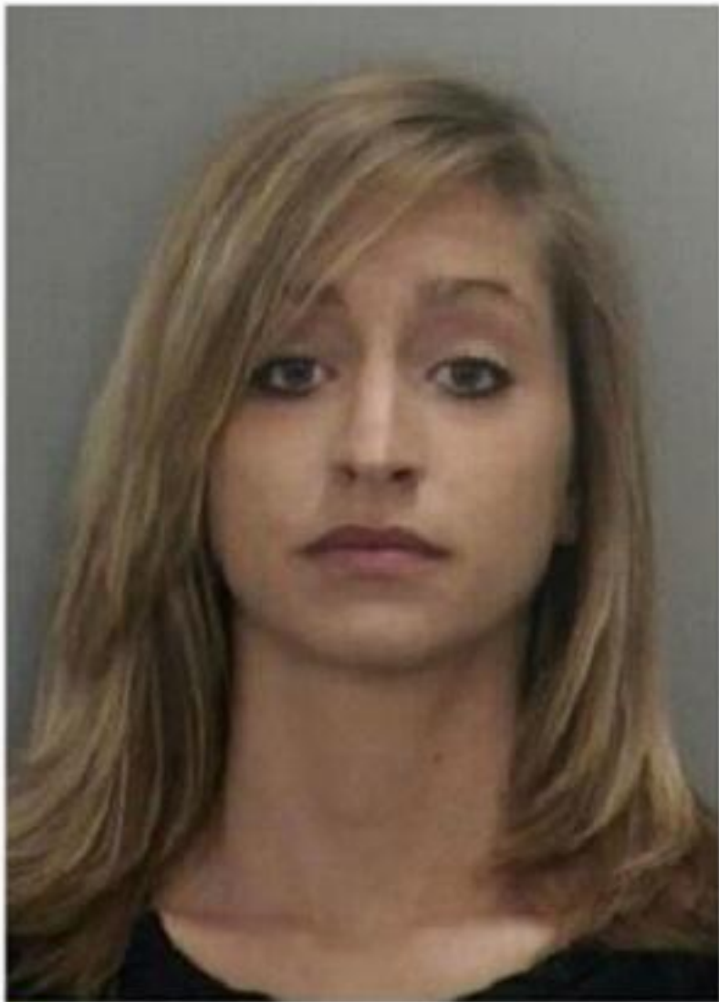
1 AGE: 22