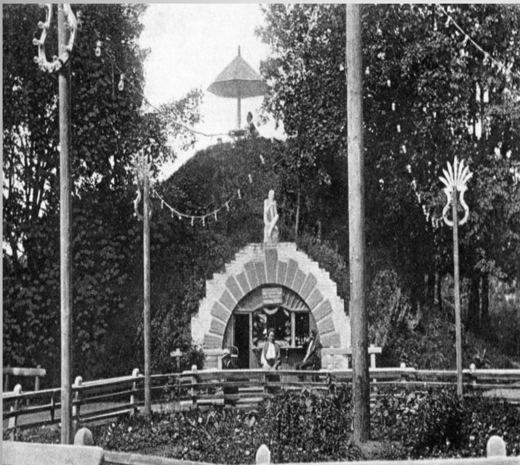
Смоленськ. Лопатинський сад. Каземат, де трималися політичні преступники.