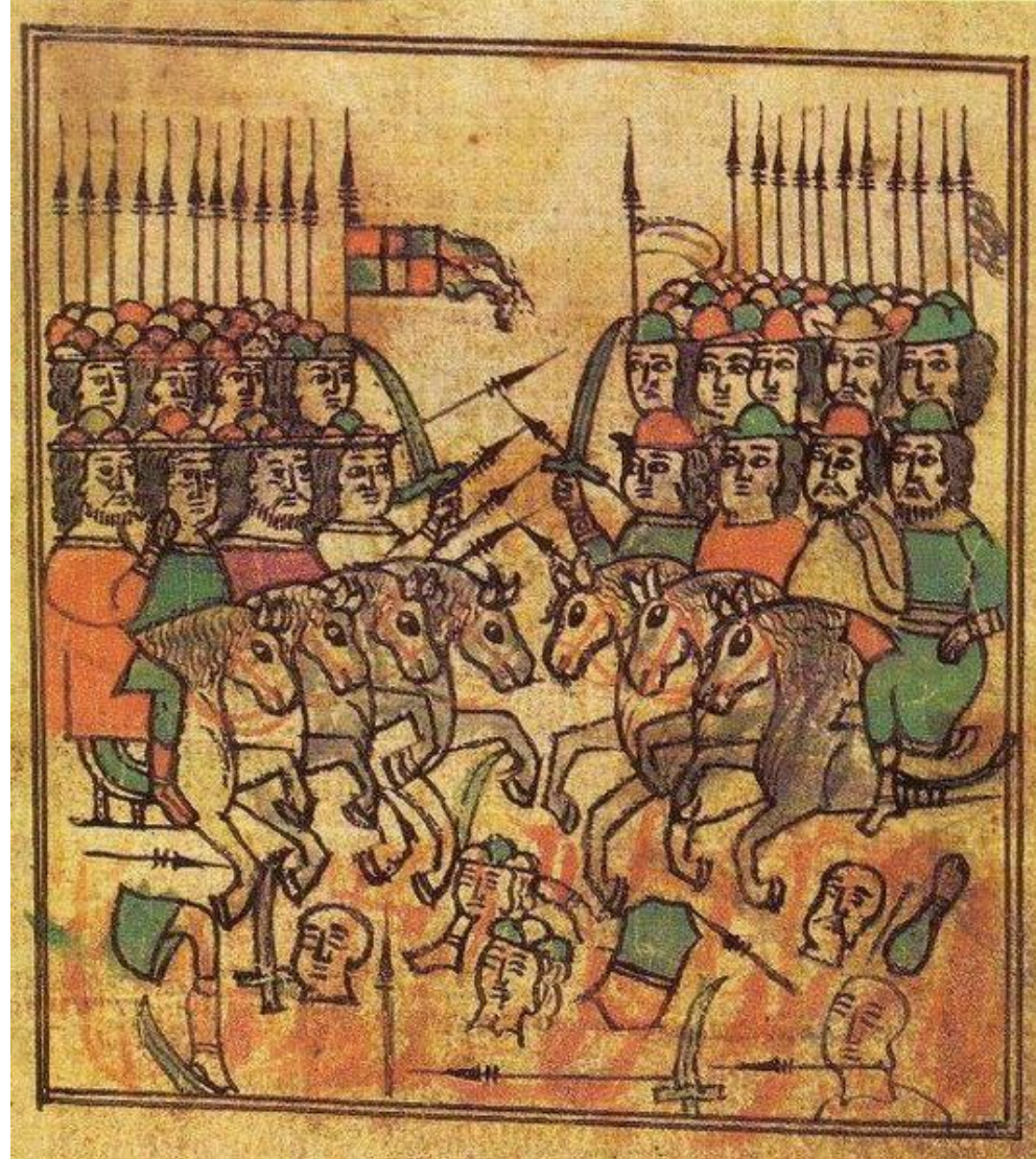
Куликовская битва. Миниатюра из летописи XVII века

Новоскольцев А. Н. Преподобный Сергий благословляет Дмитрия на борьбу с Мамаем