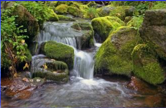
Саяно-Шушенский биосферный заповедник