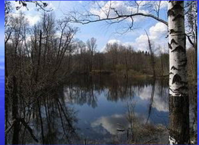
Национальный парк "Мещёра"