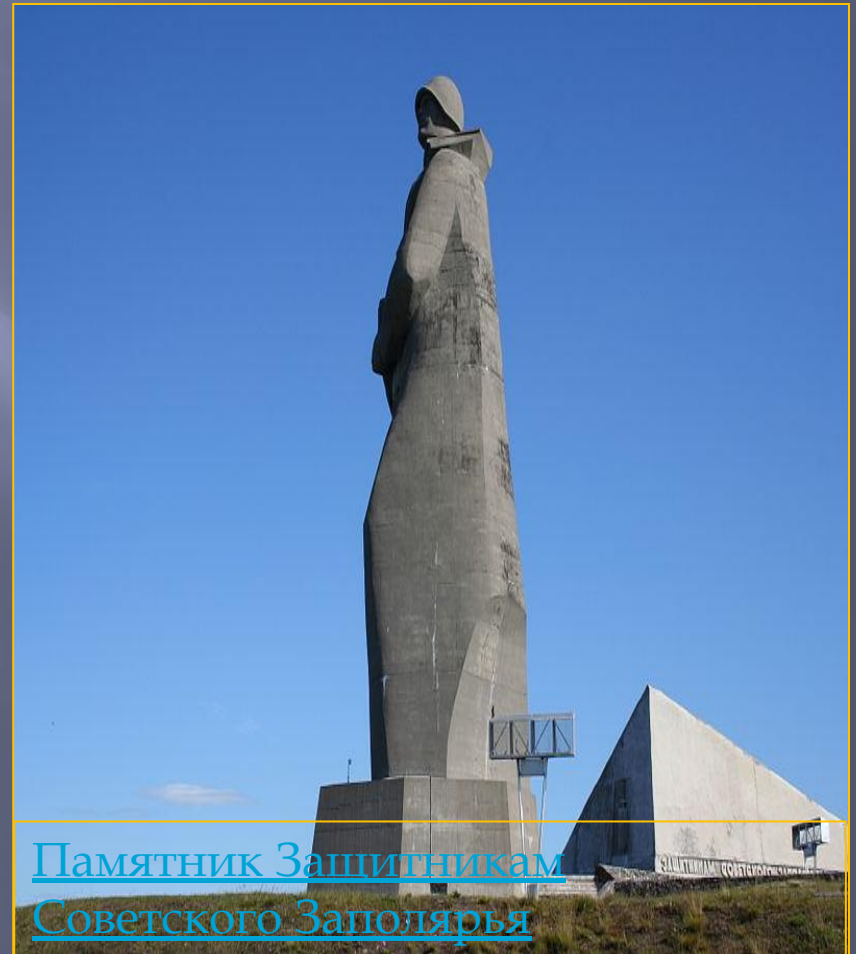
Памятник Защитникам Советского Заполярья