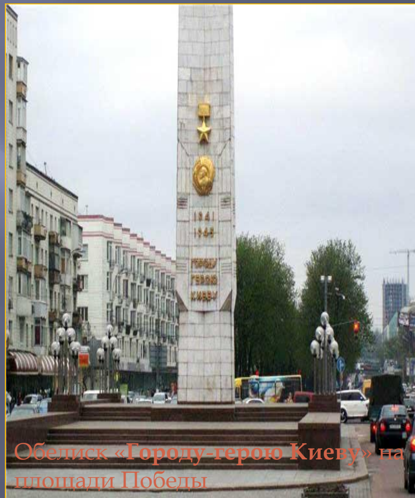
Обелиск «Городу-герою Киеву» на площади Победы