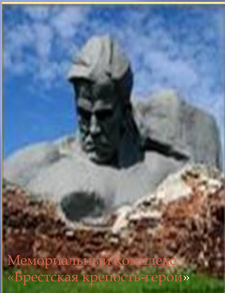
Мемориальный комплекс «Брестская крепость-герой»