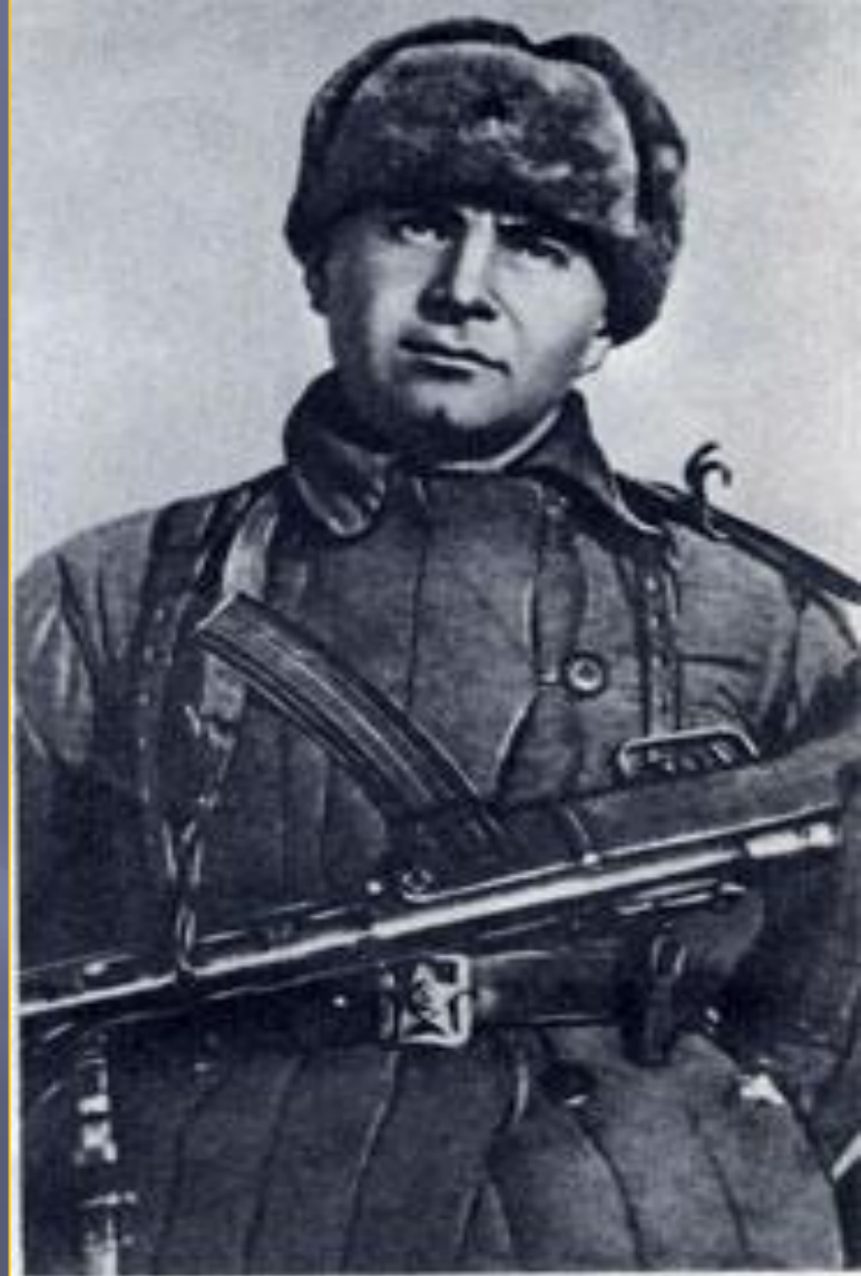
Герой Советского Союза Ц. Л. Кушников в дни боёв под Новороссийском (1943 год).