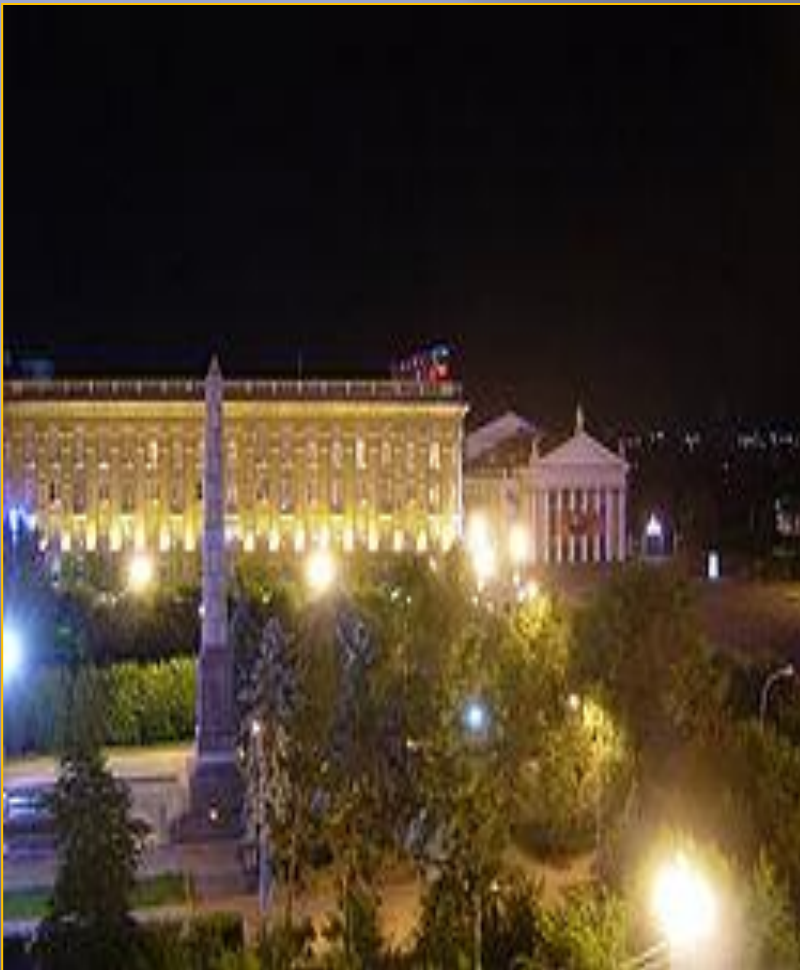
Обелиск защитникам «Красного Царицына» на Аллее Героев

Гости едут со всех континентов и стран В город мира и доблести ратной, Где стоит легендарный Мамаев курган, Где война повернула обратно.