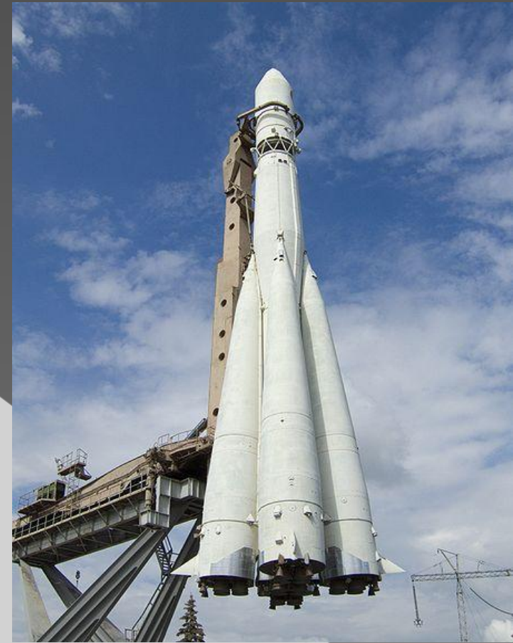
Макет ракеты-носителя “Восток” в Москве

Восток — наименование серии советских космических кораблей, предназначенных для полётов по околоземной орбите. Создавались под руководством генерального конструктора Сергея Павловича Королёва с 1958 по 1963 год.