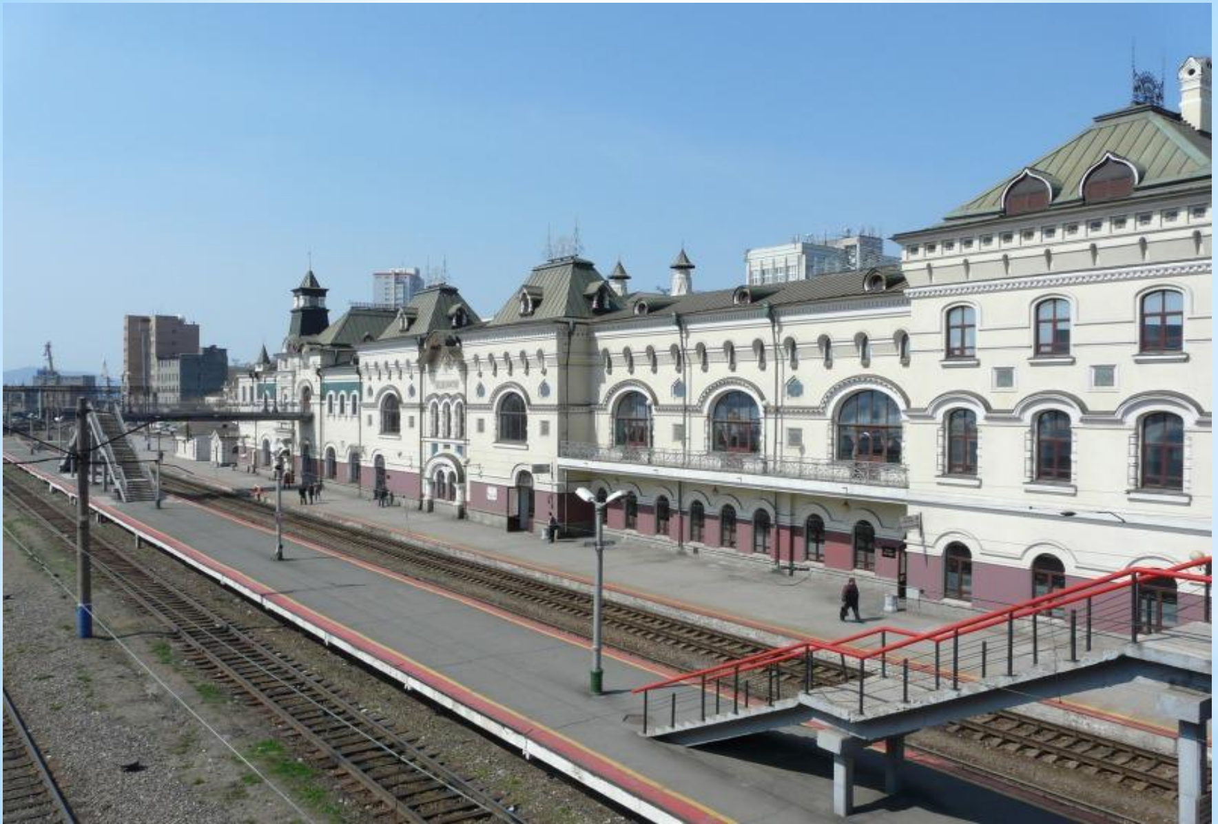
Железнодорожный вокзал – одно из многих строений Старого Владивостока.