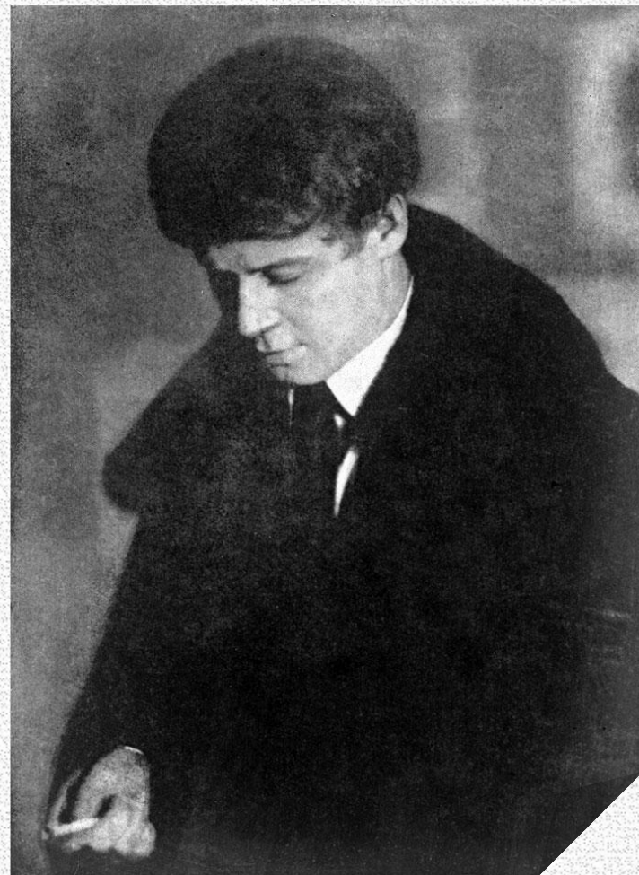
Сергей Есенин в 1924 году

В 1924-25 Есенин пишет такие известные стихотворения, как "Русь уходящая", "Письмо к женщине", "Письмо матери", "Стансы"; цикл "Персидские мотивы".