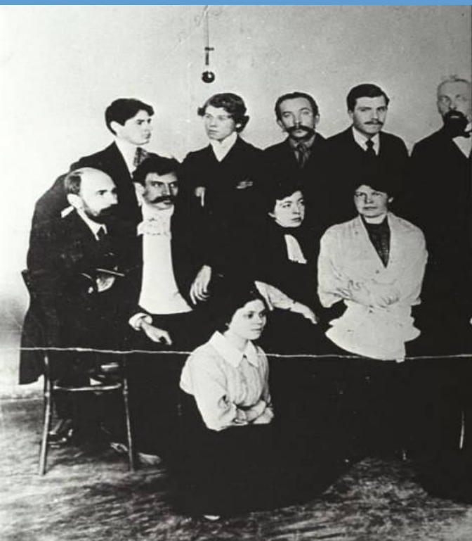
Сергей Есенин с работниками типографии, 1914 год

В Семнадцать лет уехал в Москву, где работал корректором в типографии; продолжал писать стихи. В 1912 году поступил в Народный университет А. Шанявского на историко-философское отделение, где проучился полтора года.