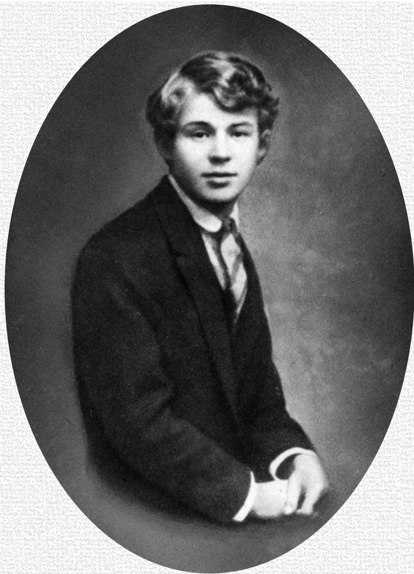
Сергей Есенин в 1913 году