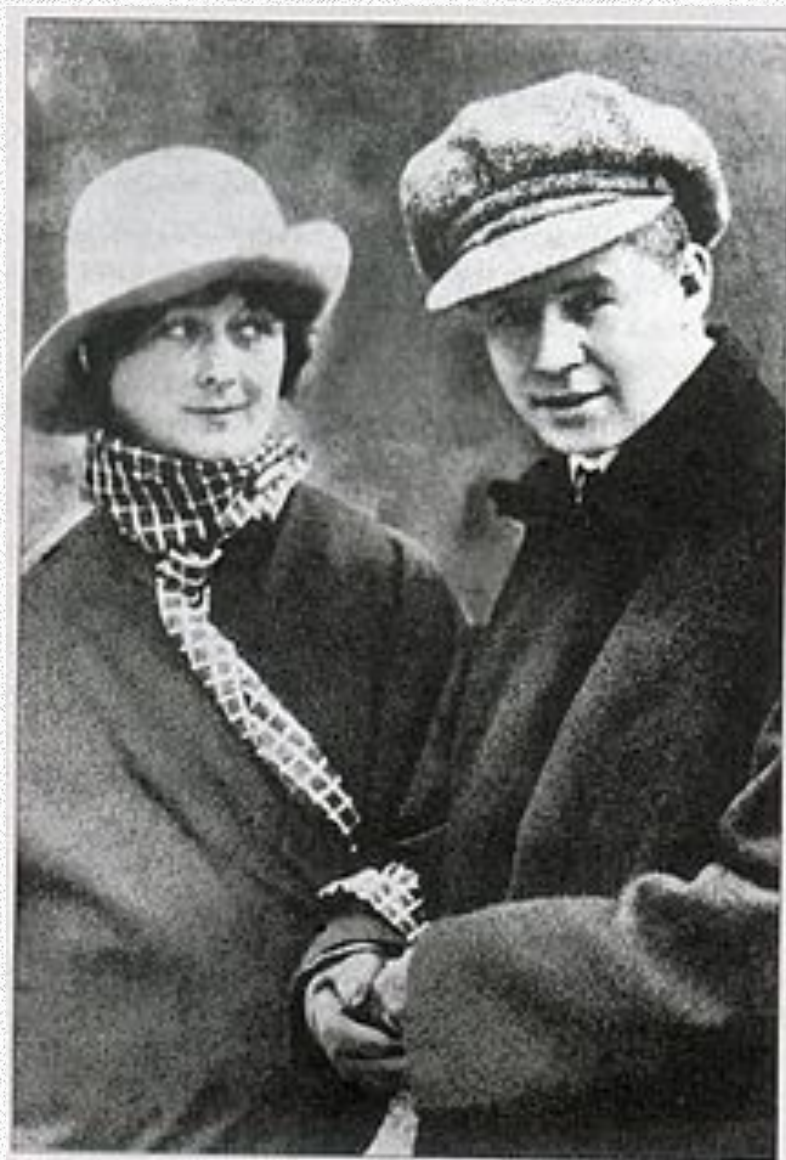
Есенин и Айседора Дункан, 1922

Осенью 1921 года в мастерской Г. Б. Якулова Есенин познакомился с танцовщицей Айседорой Дункан, на которой он через полгода женился. Газета «Известия» опубликовала записи Есенина об Америке «Железный Миргород». Брак с Дункан распался вскоре после их возвращения из-за границы.