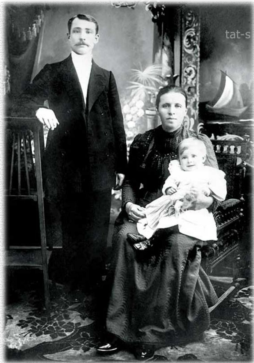
Родители Сергея Есенина.