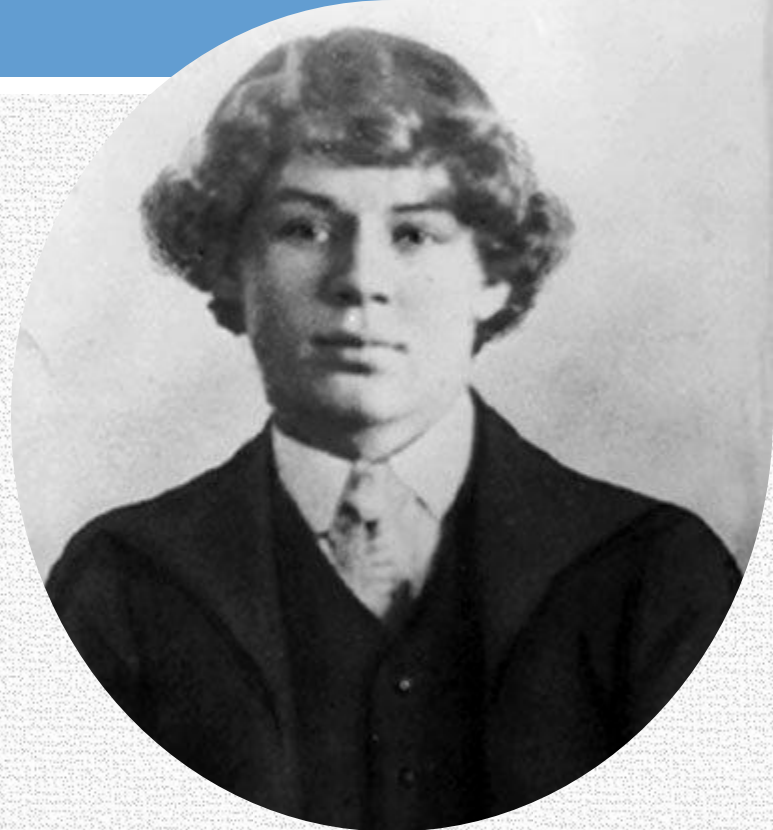
Есенин, 1914 год, Москва

В Семнадцать лет уехал в Москву, где работал корректором в типографии; продолжал писать стихи. В 1912 году поступил в Народный университет А. Шанявского на историко-философское отделение, где проучился полтора года.