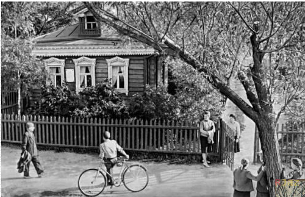
Село Константиново Рязанская губерния. Дом , где родился С.А. Есенин