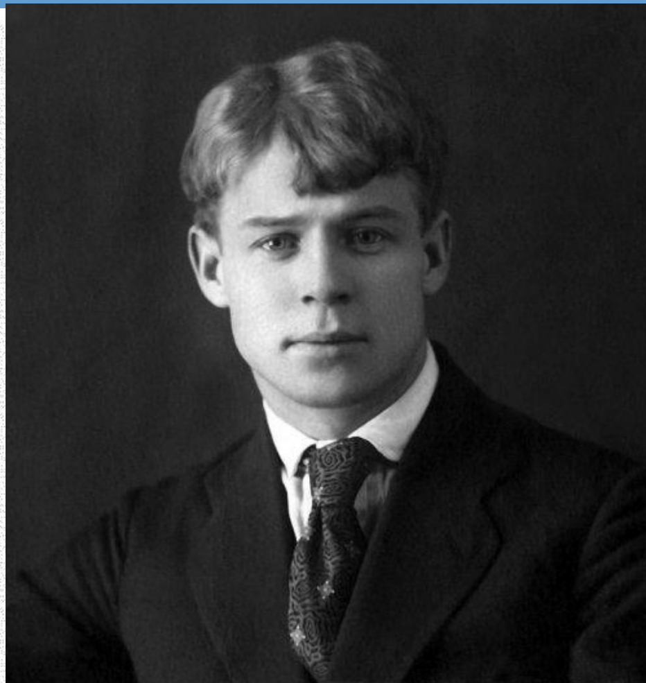
Сергей Есенин, конец 1921 - начало 1922 года

В 1921 году поэт отправился в путешествие по Средней Азии, посетил Урал и Оренбуржье.