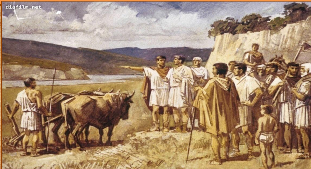
К делу! Братья Тиберий и Гай Гракхи руководят размежеванием земли.

«Запретить всем римским семьям владеть более чем тысячью югеров государственной земли». Югер – это римская мера площади, составляла примерно четверть гектара. «После забрать у богачей излишки земли (то, что было сверх 1000 югеров) и разделить их между бедными гражданами (не более 30 югеров каждому гражданину) с таким условием, что полученную землю нельзя будет продавать».