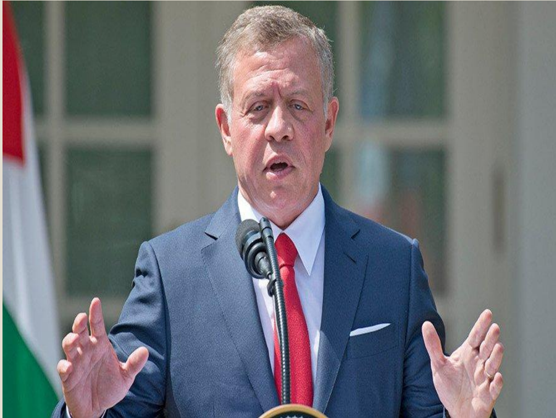
Король Иордании - Абдалла Второй