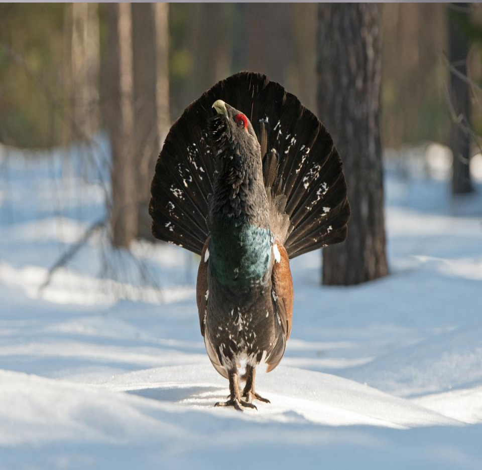
ГЛУХАРЬ (ЛАТ. TETRAO UROGALLUS)