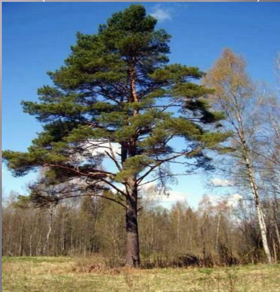
СОСНА ОБЫКНОВЕННАЯ (ЛАТ. PINUS SYLVESTRIS)