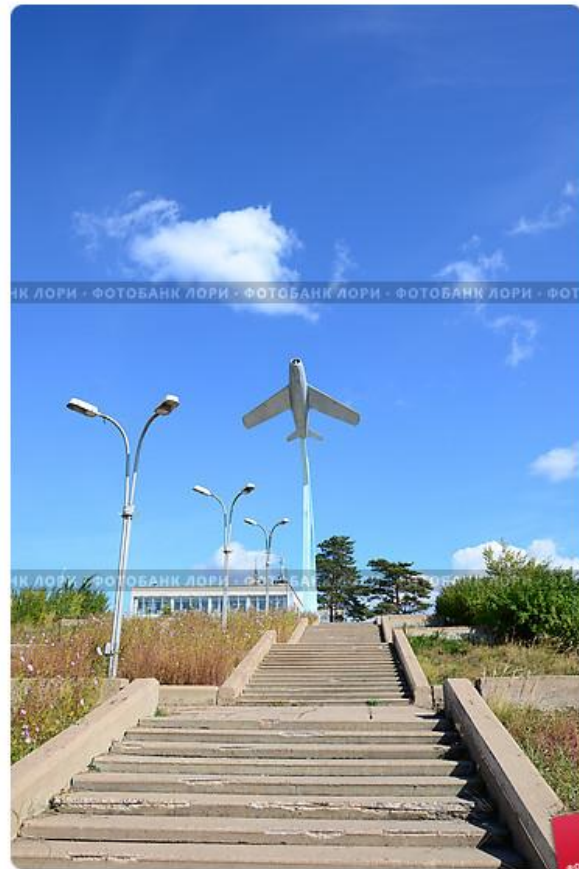
Стела "Самолет". Авиационный завод. Улан-Удэ