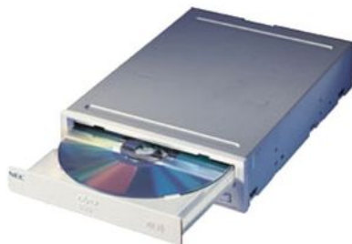
Устройство для чтения оптических дисков