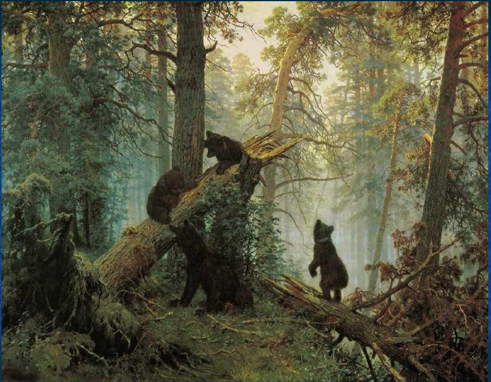
Утро в сосновом лесу.