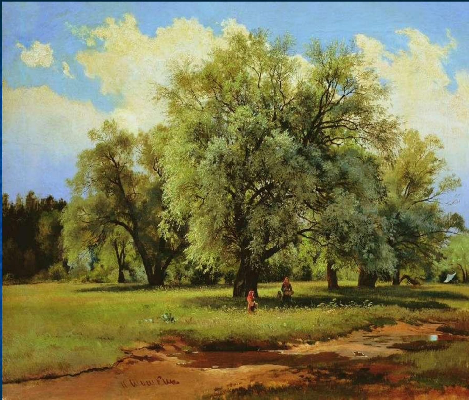
Ивы, освещённые солнцем.