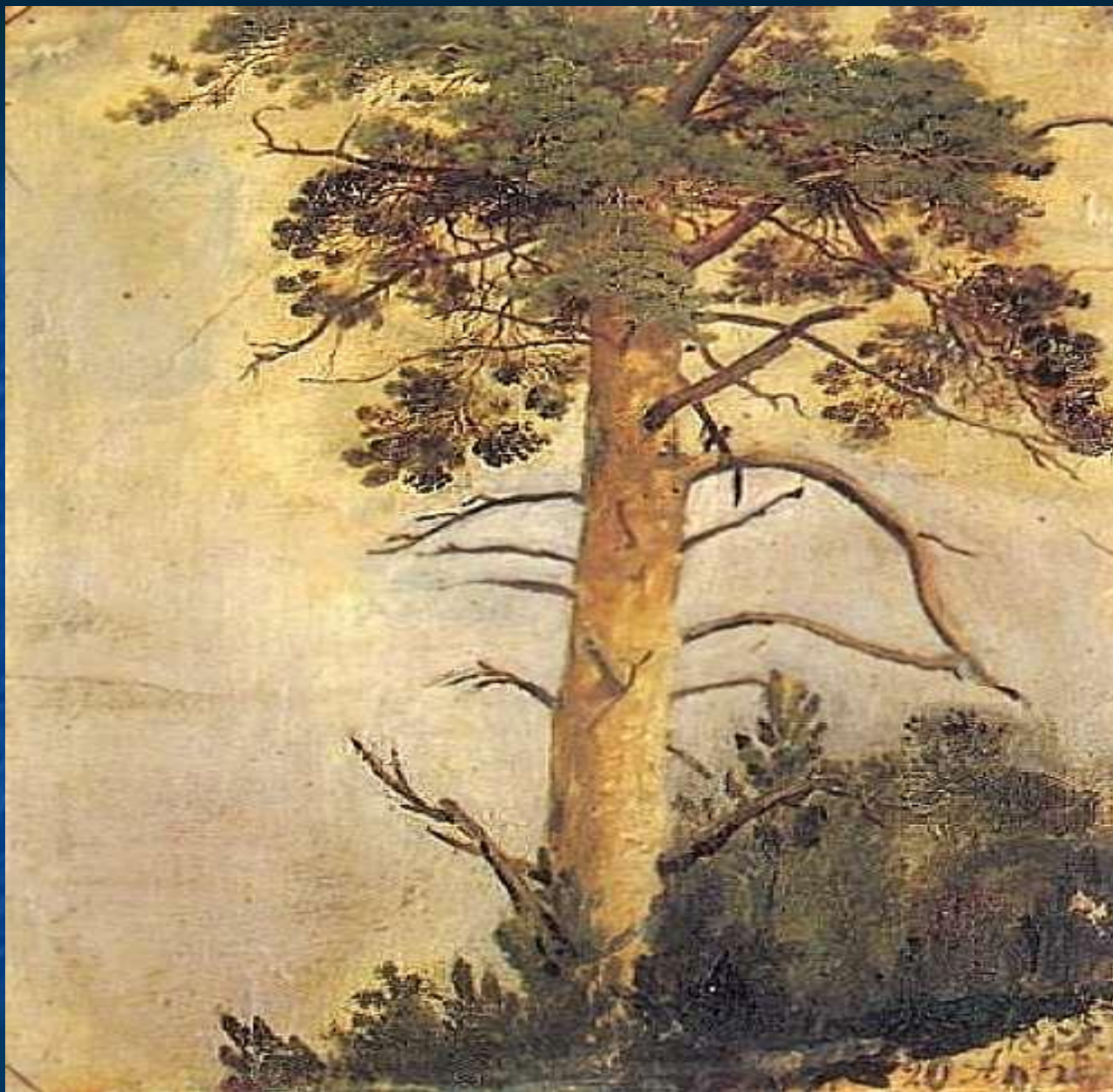
Сосна на скале.