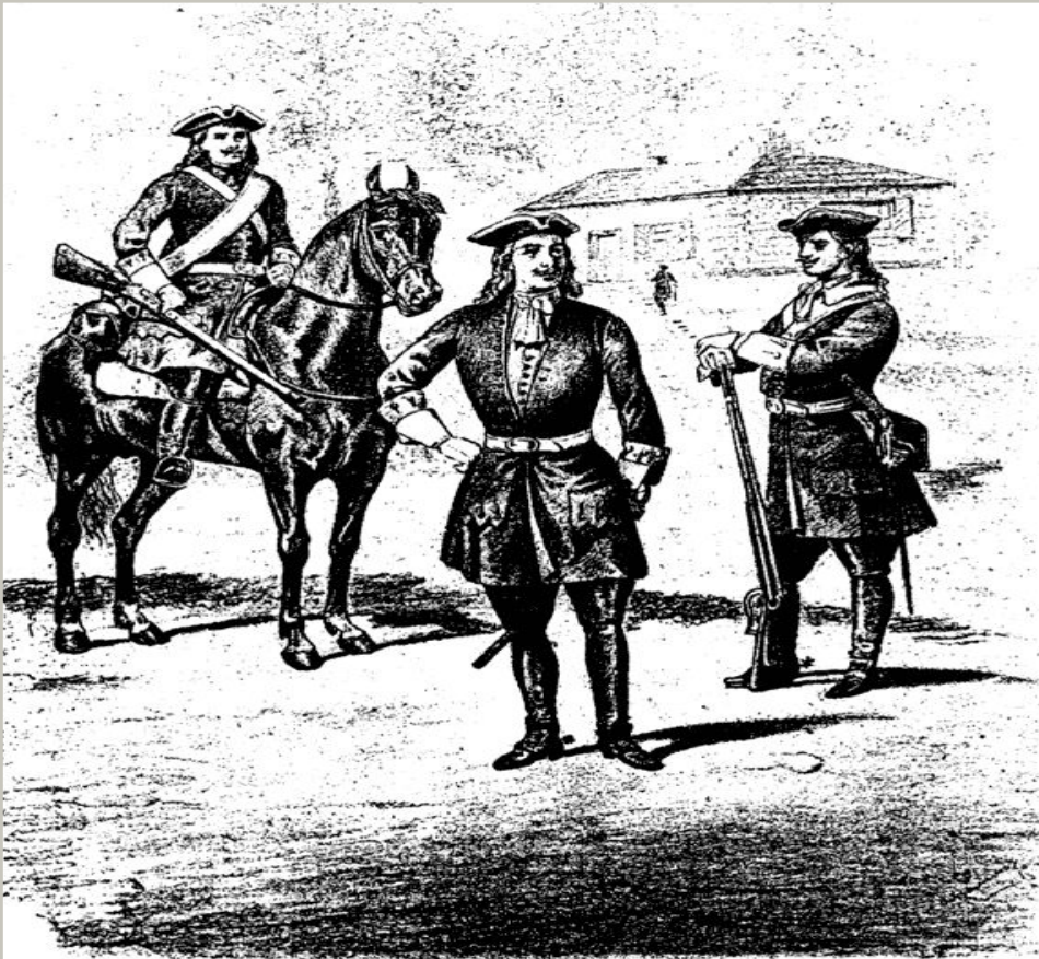
Драгуны Петра Великого

Ритуал подписи «присяжных листов» при Петре I После принесения присяги в строю присягающие подписывали индивидуальные клятвенные обещания - "присяжные листы".