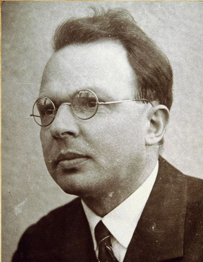
Рудольф Карнап (1891-1970)

Важным результатом Карнапа в анализе соотношения теории и опыта является строго формализованная количественная теория логической вероятности, то есть степени индуктивного, или вероятностного, подтверждения теории