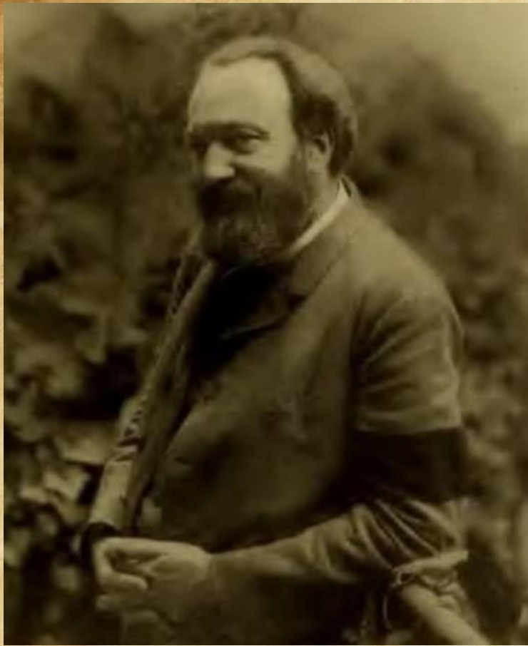
Рихард Авенариус (1843-1896)

Рихард Авенариус был основоположником эмпириокритицизма, суть которого в «очищении опыта» от всего того, что опытом не является, т.е. от «метафизических прибавлений». В результате раскрывается «единство опыта», который в основе своей есть «жизнь».