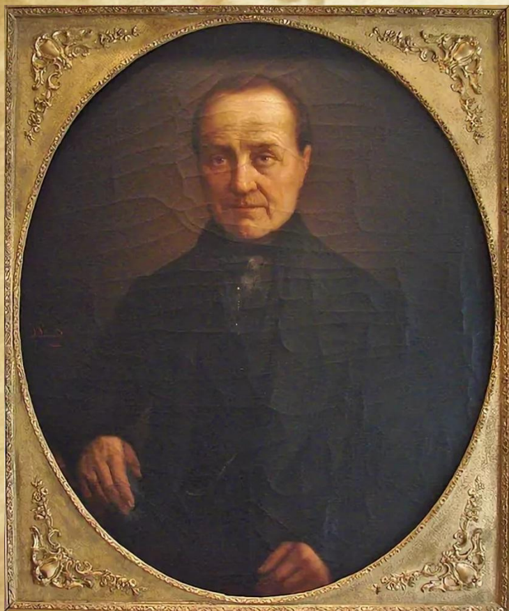
Огюста Конта (1798-1857)