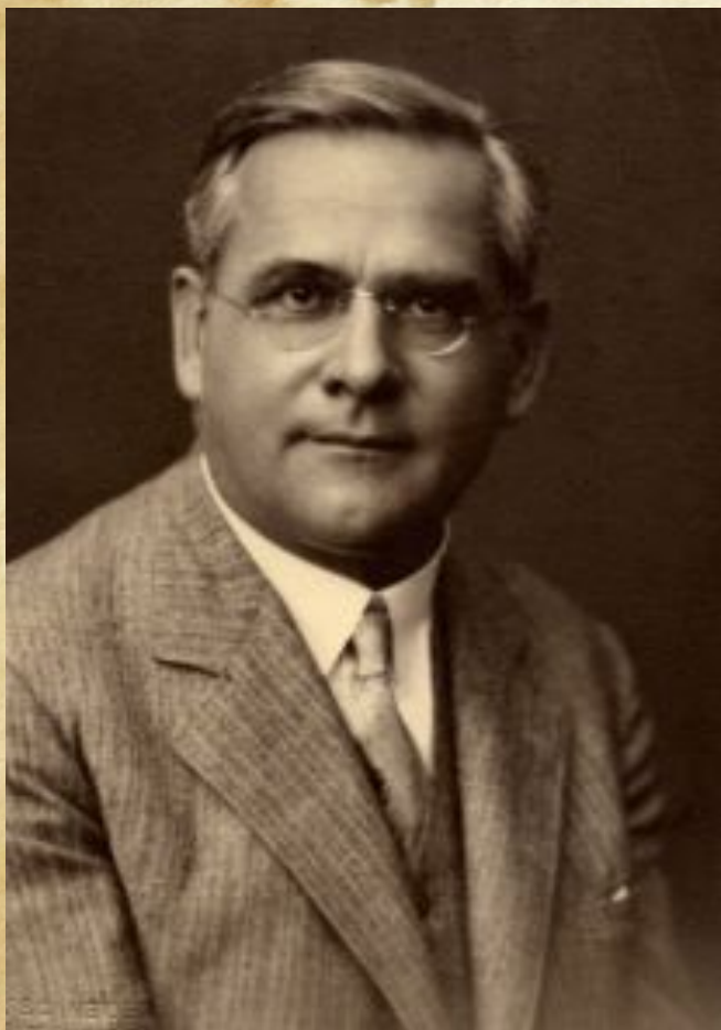
Мориц Шлик (1882-1936)