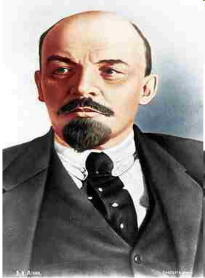
Председатель Совета Народных Комиссаров В. Ульянов (Ленин).

Верховным руководящим органом Рабоче-Крестьянской армии является Совет Народных Комиссаров. Непосредственное руководство и управление армией сосредоточено в Комиссариате по военным делам в созданной при нем особой Всероссийской коллегии.