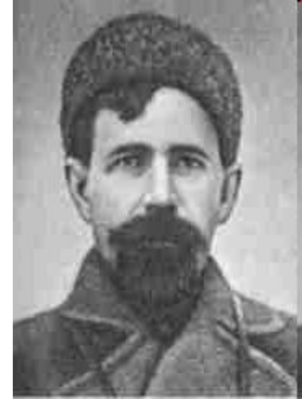
Народные Комиссары по военным и морским делам: П. Дыбенко (на фото) и Н. Подвойский.