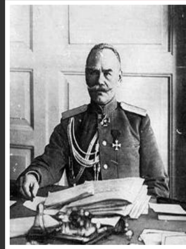
Верховный руководитель Добровольческой армии А.В.Алексеев

Дальний Восток: высадка американских и японских войск.