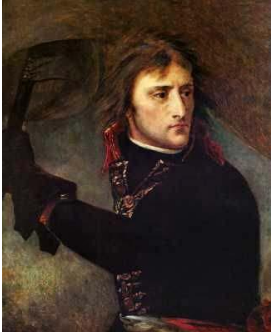
Антуан-Жан Гро. Наполеон на Аркольском мосту. Ок. 1804 г. Х.,м. 73 x 59 Париж, Лувр.