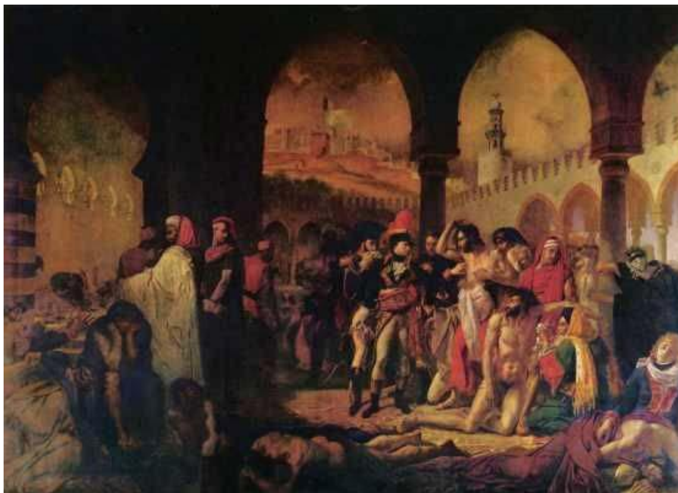
А.-Ж. Гро. Наполеон посещает чумных в Яффе. 1804 г. 532 x 720 X., м. Париж, Лувр.

После успеха этой картины Гро выполняет ряд официальных заказов на крупные батальные композиции. К числу лучших его произведений относится картина «Зачумленные в Яффе» (1804, Лувр), изображающая эпизод из египетского похода Бонапарта. Он наполняет двор фантастической мавританской мечети больными и умирающими, показывая целую гамму разнообразных чувств, различные стадии страдания. Таким образом, Гро вносит в выполнение официальной программы ноты реальности и гуманности и одновременно открывает своей картиной путь увлечения экзотическим Востоком, который станет одним из существенных компонентов последующей романтической живописи.