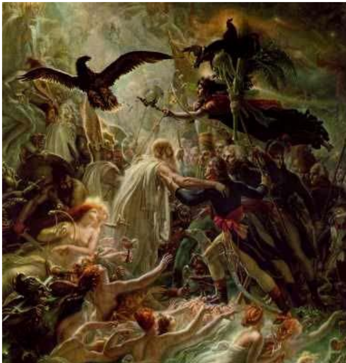
А.-Л. Жироде-Триозон. Апофеоз французских героев, павших в войне за независимость родины. Нач. XIX в. Х., м. 192 x 182 Париж, Национальный музей Мальмезон.