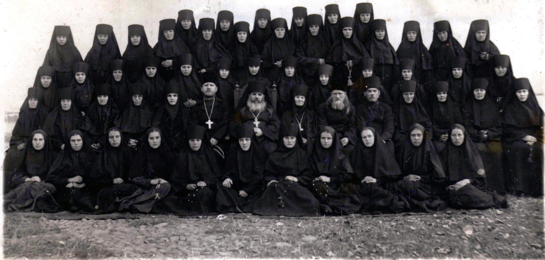
Объединенный Николаевский женский Монастырь. в гор. Мусарове. 23/8-49г.