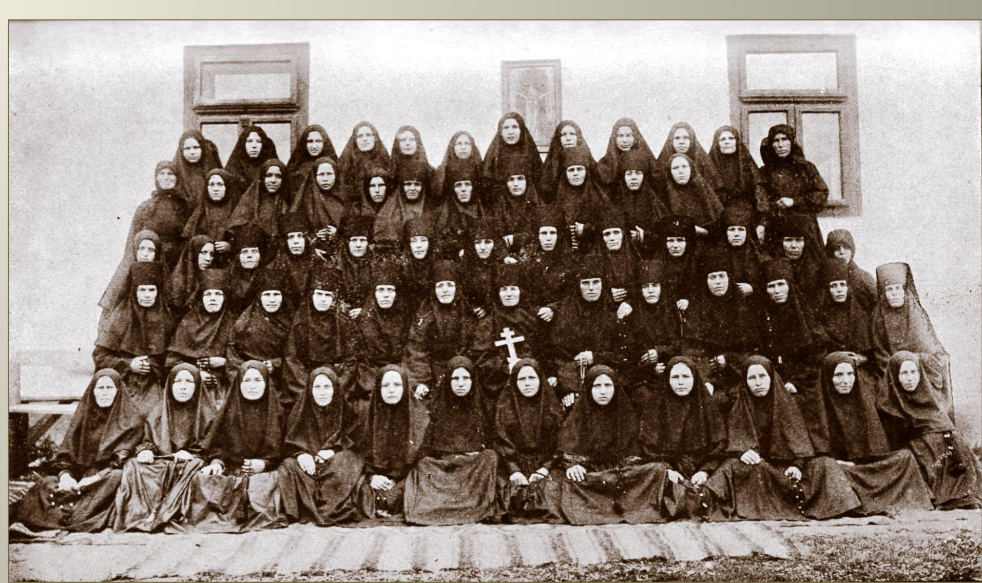
Насельниці жіночого монастиря в с. Липча, 1930 р.