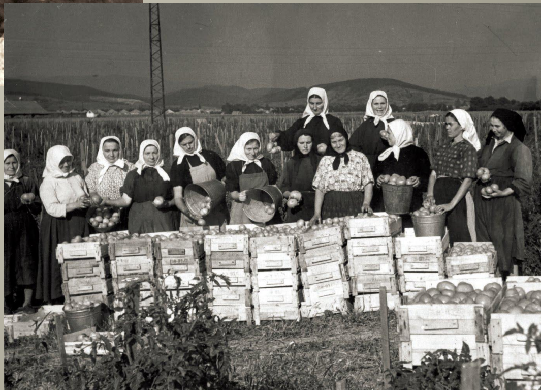
На заготівлі монастирських яблук