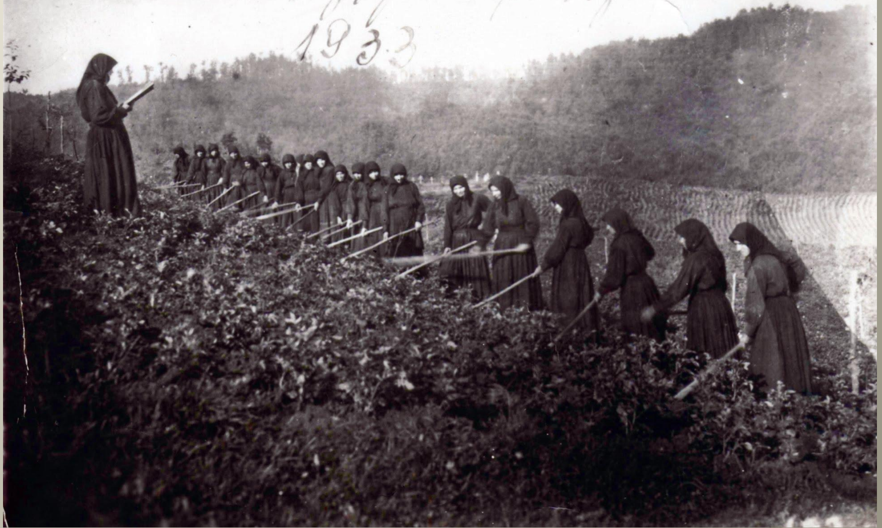
Сестри Липчанського монастира на послуху.

Далко наоми носуци... Сестри Липчанско монахи. Монахи у ризици 1933