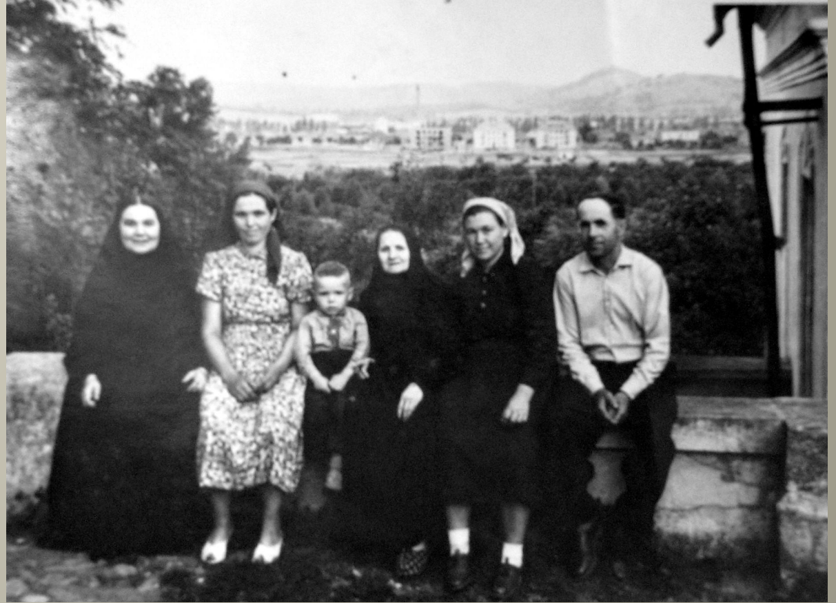
З родиною з с. Іза.