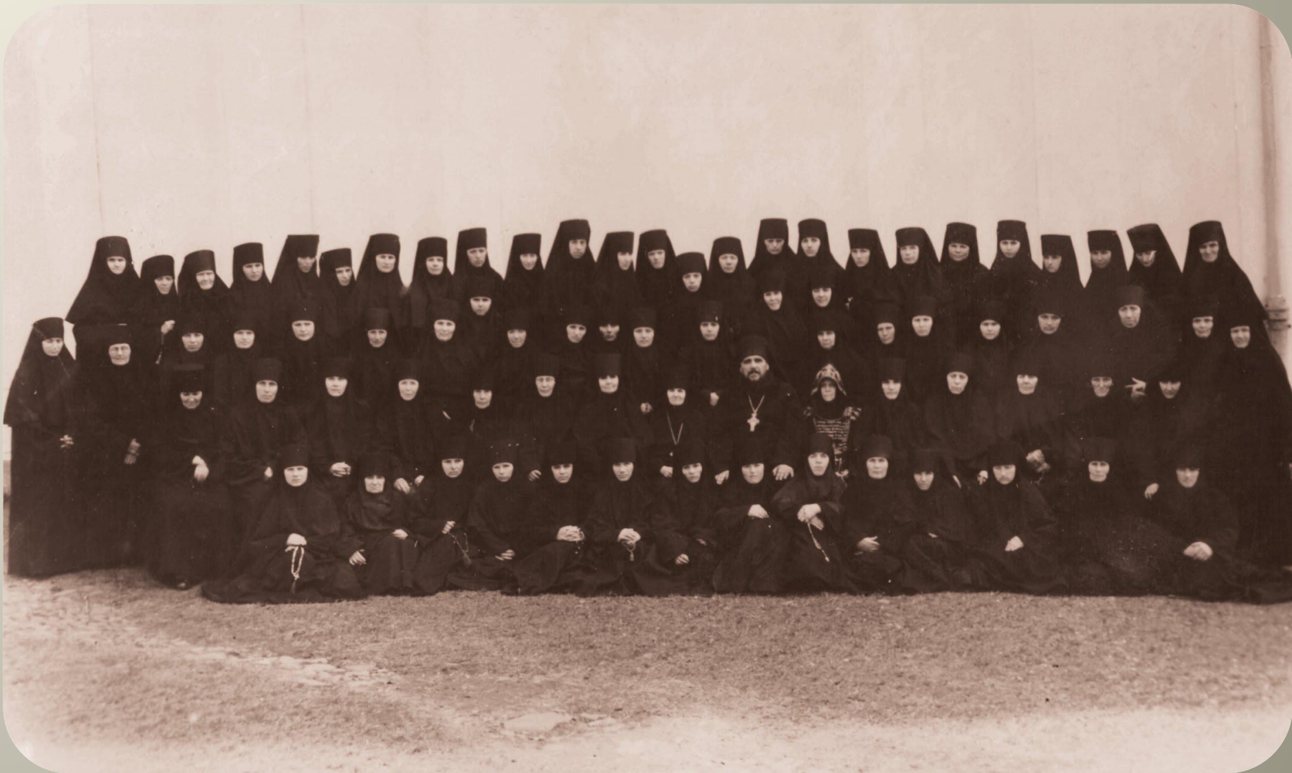
600-річчя Мукачівського монастиря, 1960 р.