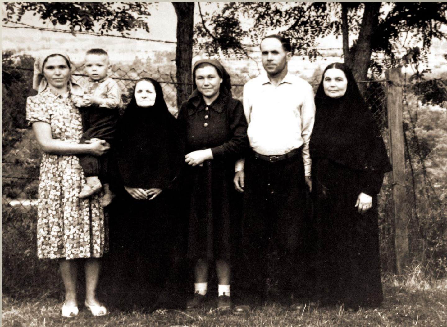
В колі родини з с. Іза