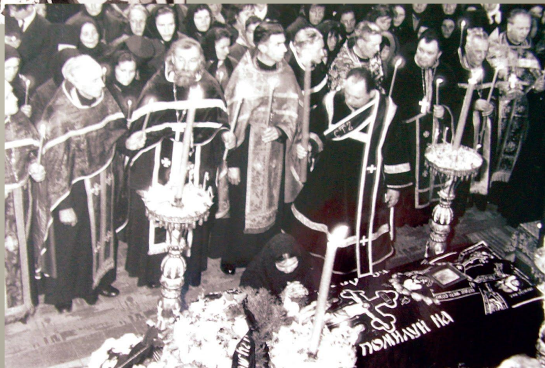
Похорони матушки Параскеви