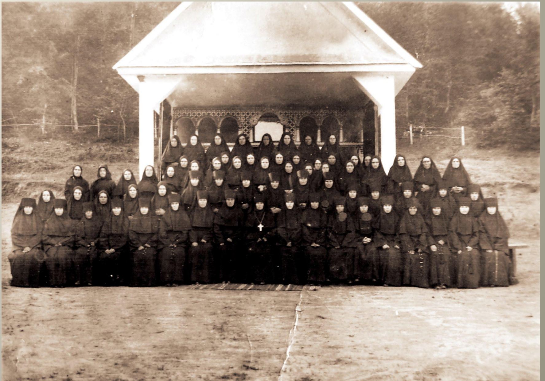
Сестри Липчанського монастиря, 1945-1947 рр.