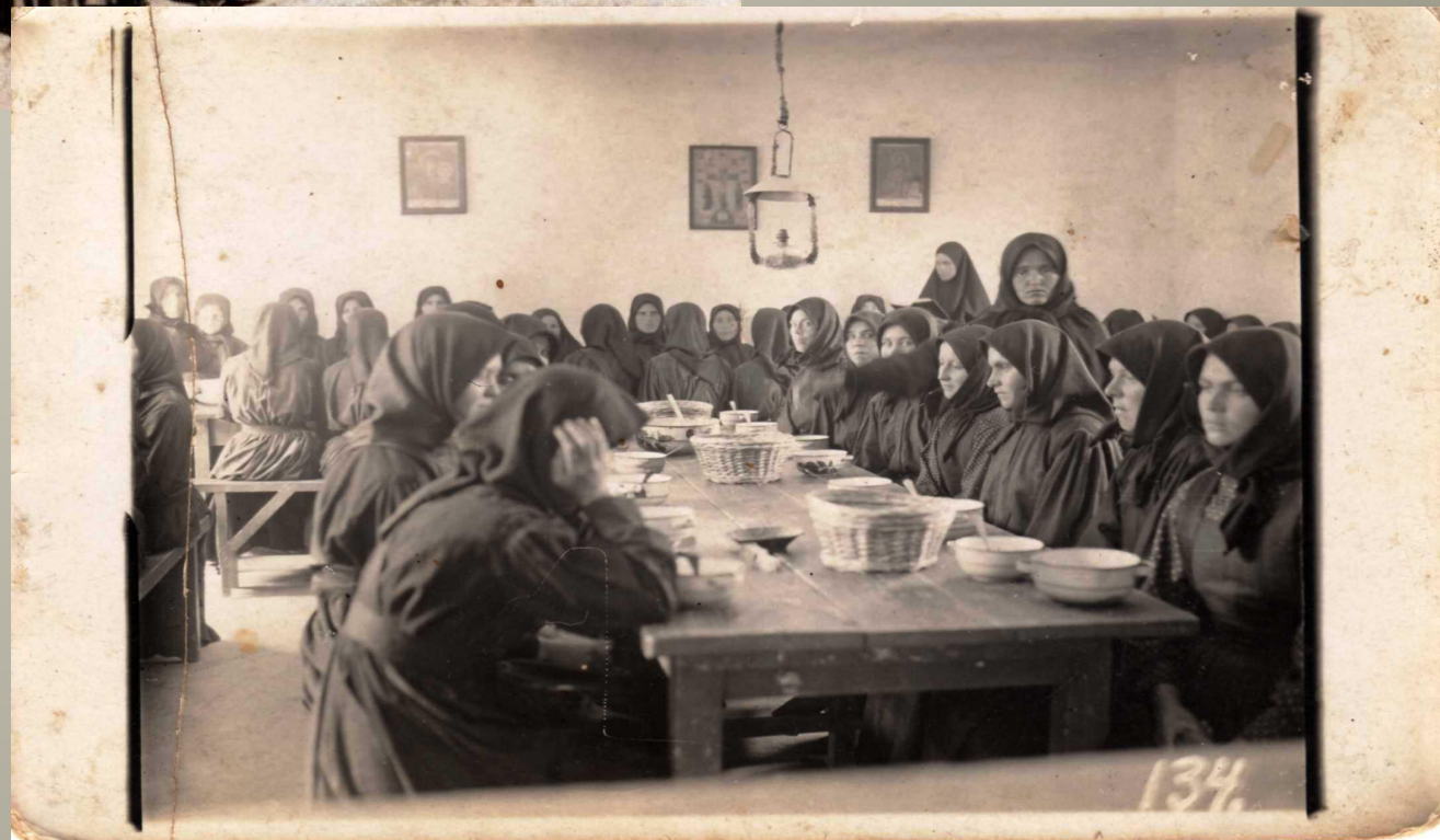
Липчанський монастир, 1930-ті рр.