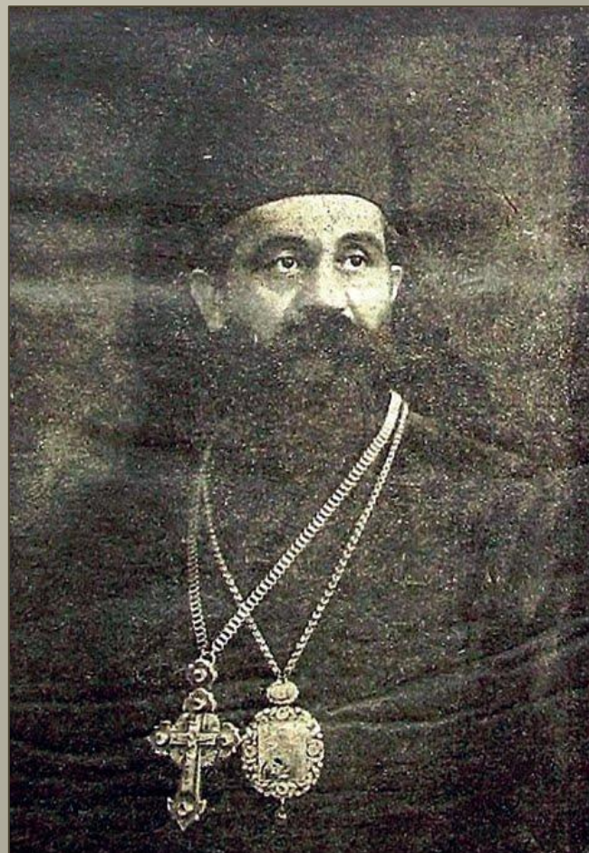
Владика Досифей (Васич)