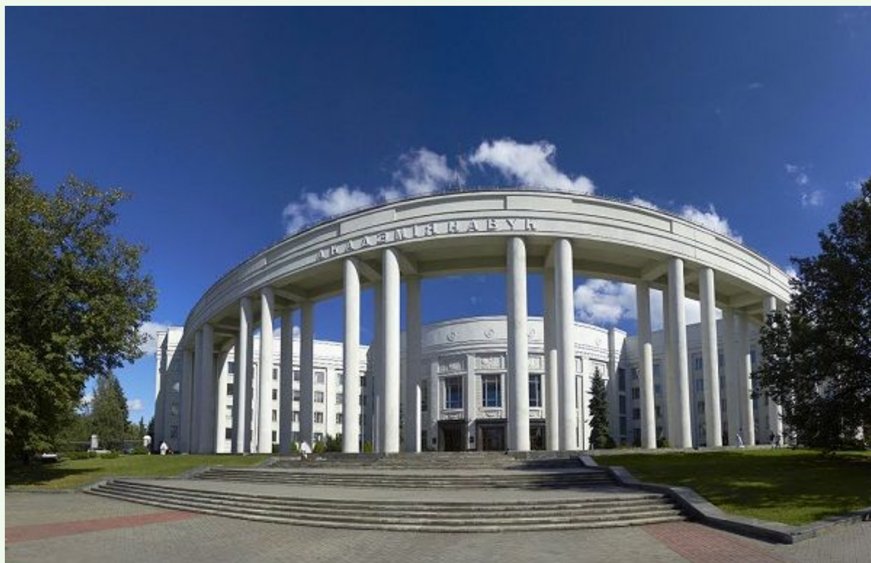
НАЦИОНАЛЬНАЯ АКАДЕМИЯ НАУК РБ