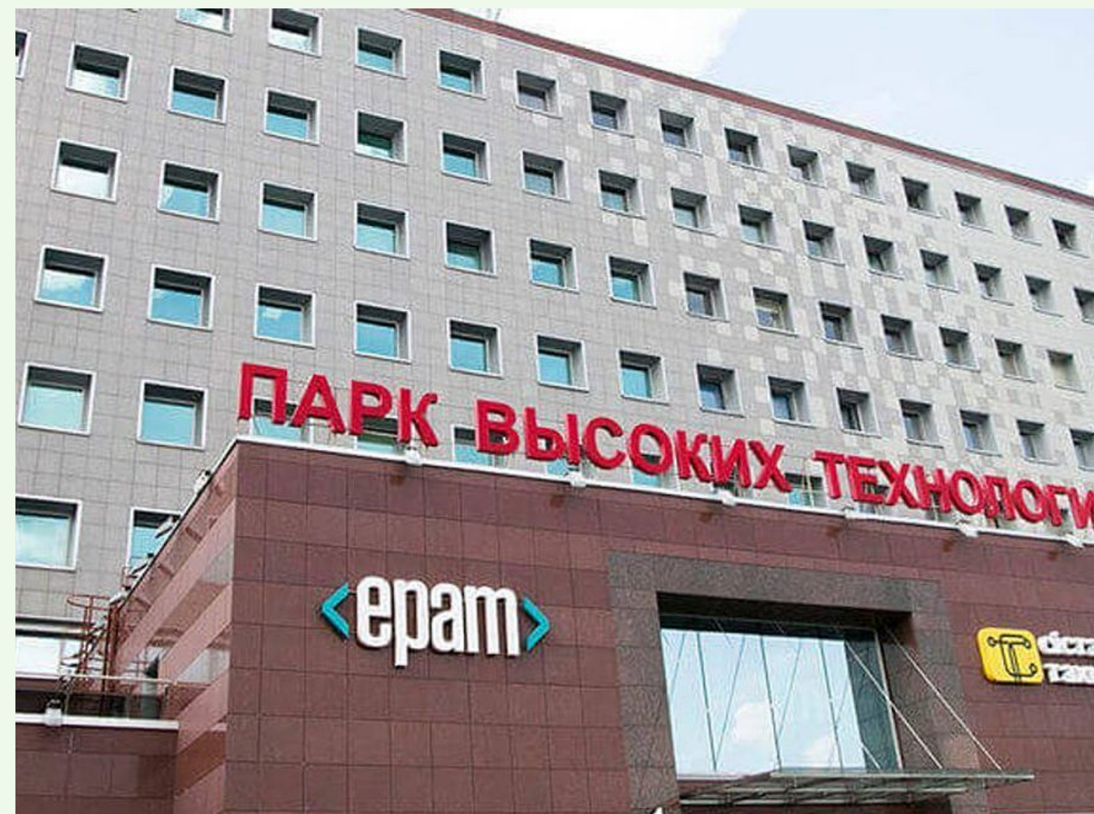
ПАРК ВЫСОКИХ ТЕХНОЛОГИЙ