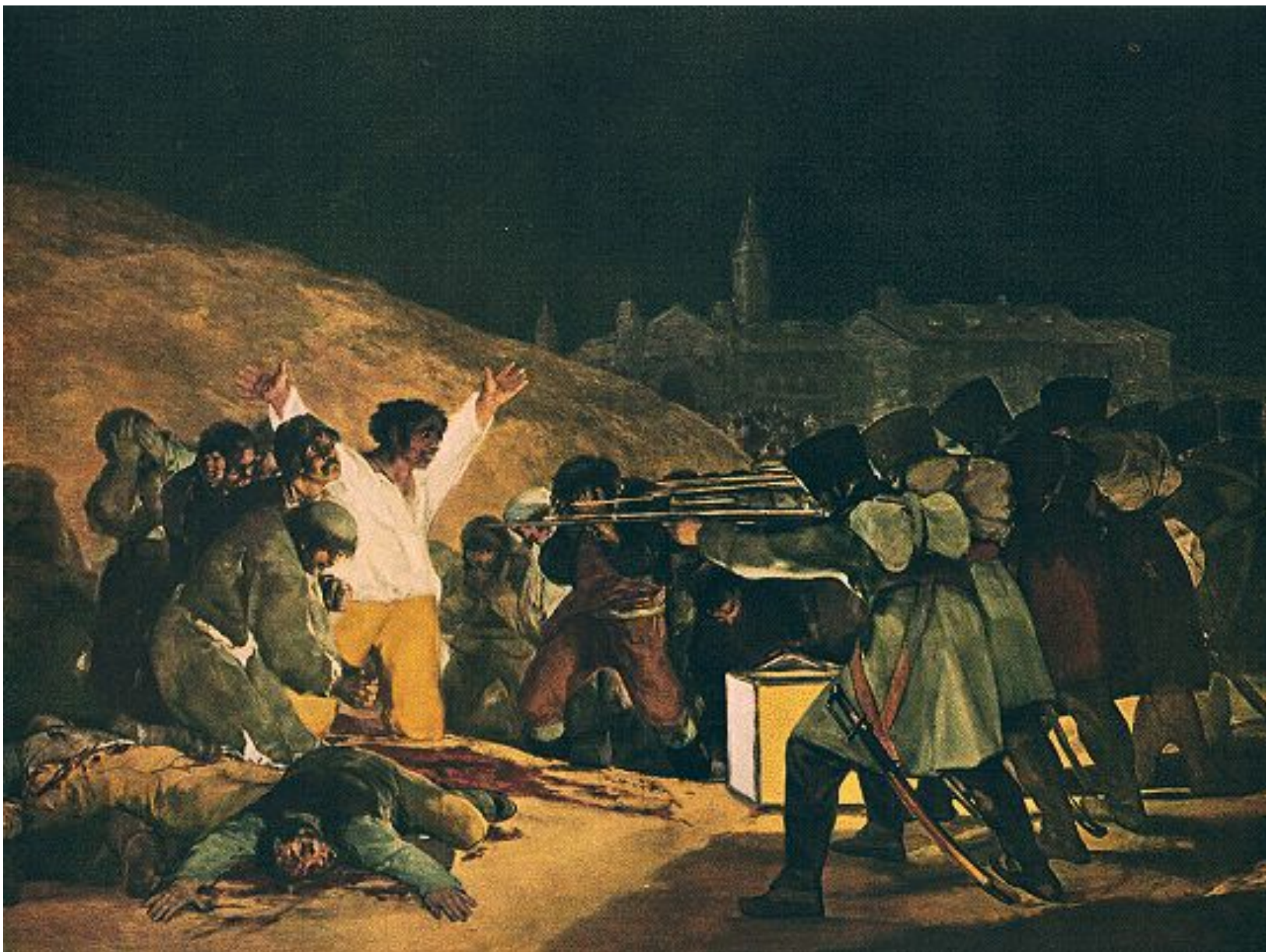
Гойя . «Расстрел повстанцев»

В Мадриде вспыхнуло народное восстание. 3 мая 1808 года- расстрел повстанцев.