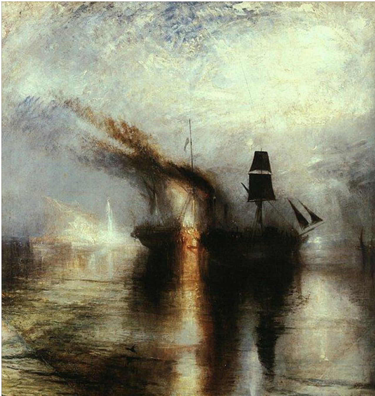
Тёрнер. Вечный покой. Похороны в море. 1842