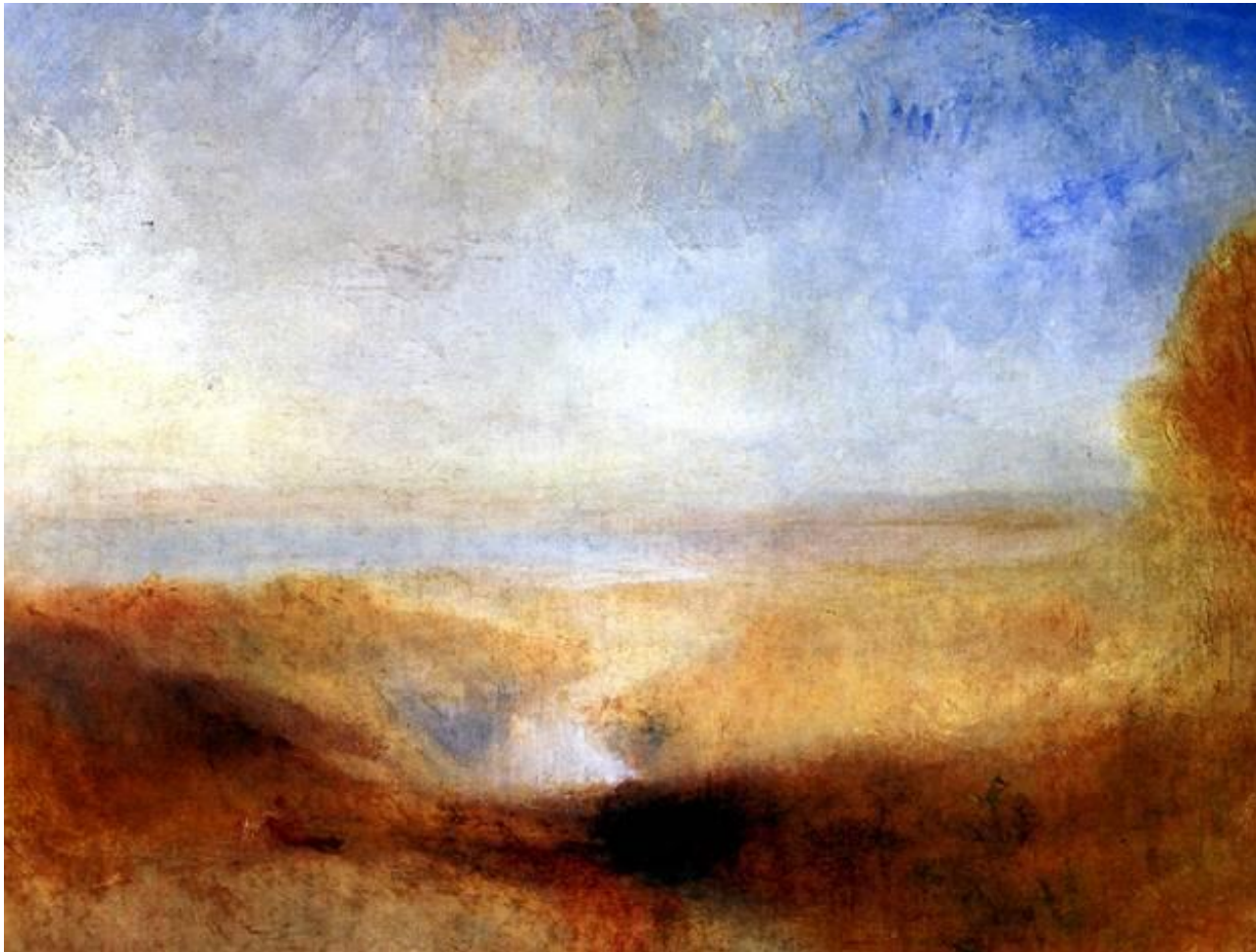
ТЁРНЕР ДЖОЗЕФ МЭЛЛОРД УИЛЬЯМ Пейзаж с далекой рекой и плотиной.

И в масляной живописи, и в акварели работал в необычайно свободной технике .