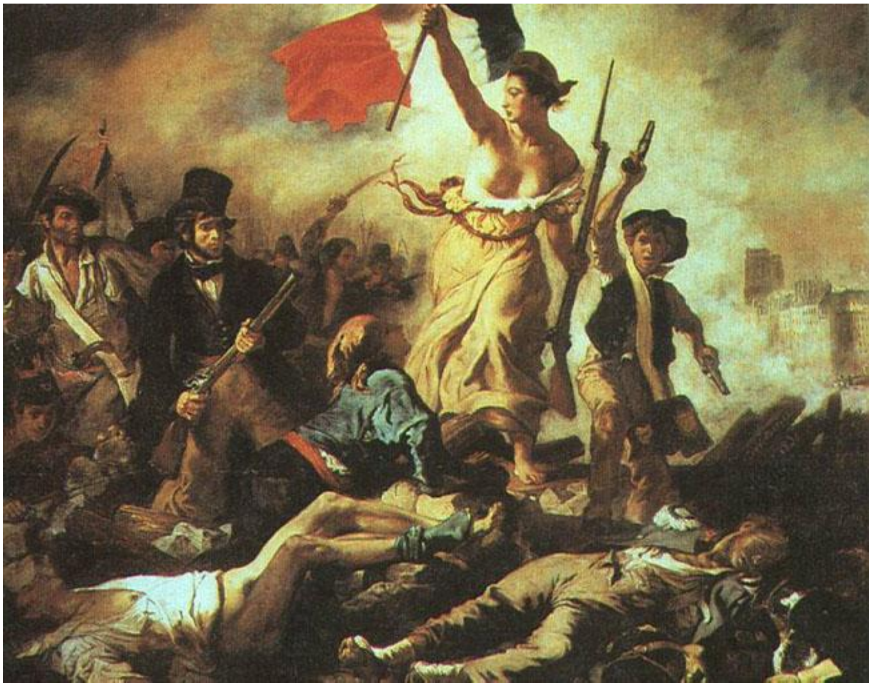
«Свобода, ведущая народ». 1831