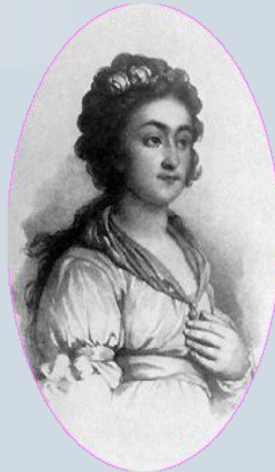
Первая жена Г.Р Державина Екатерина Яковлевна Бастидон (1760-1794)

Конфликт с Вяземским, скрывавшим государственные доходы, привел к отставке Державина с сенатской службы, но с 1784 г. по воле Екатерины II он назначается губернатором Олонецкого края. Борьба за законность с наместником генерал-губернатором Тутолминым закончилась поражением Державина, и года не пробывшего на этом посту. Последовало новое назначение - тамбовским губернатором. Державин успел много сделать для просвещения Тамбовского края, но попытки отстаивать справедливость и нежелание "ладить" с высшими вельможами привели к смещению с должности в 1788 г. За годы, проведенные на губернаторстве, поэтическая слава Г.Р.Державина возросла.