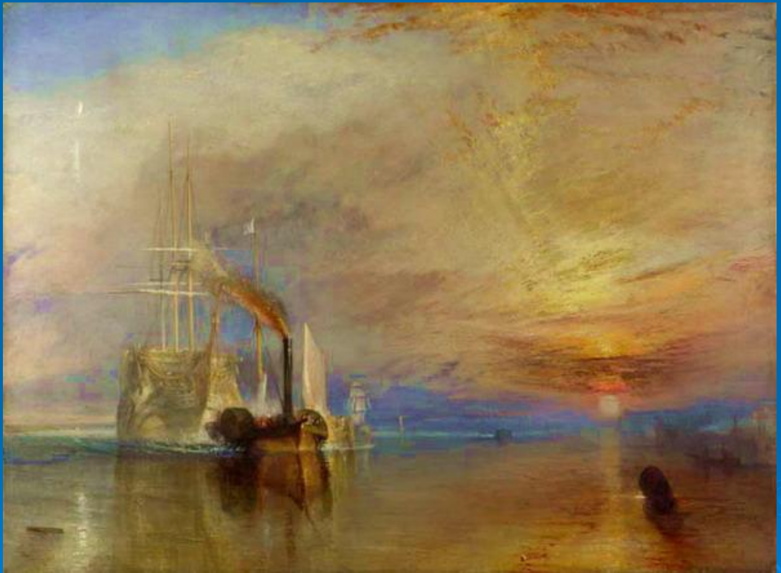
Фрегат «Смелый», буксируемый к месту последней стоянки