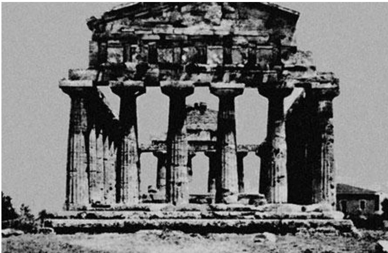
Храм Деметры в Пестуме