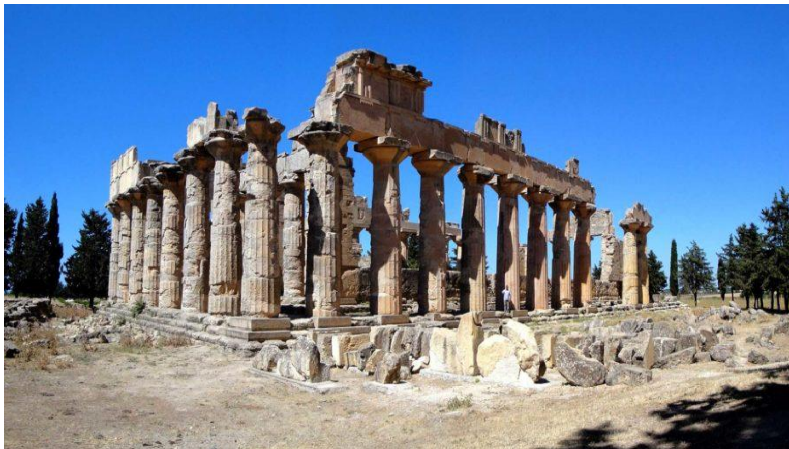
Дорический храм Зевса в Олимпии