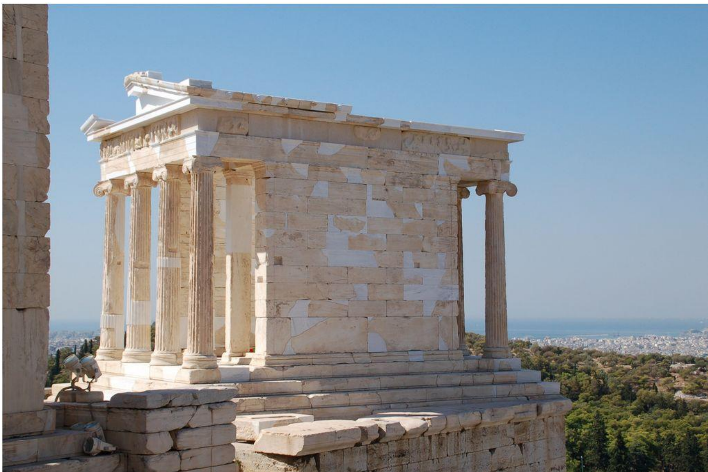
Храм Ники Аптерос