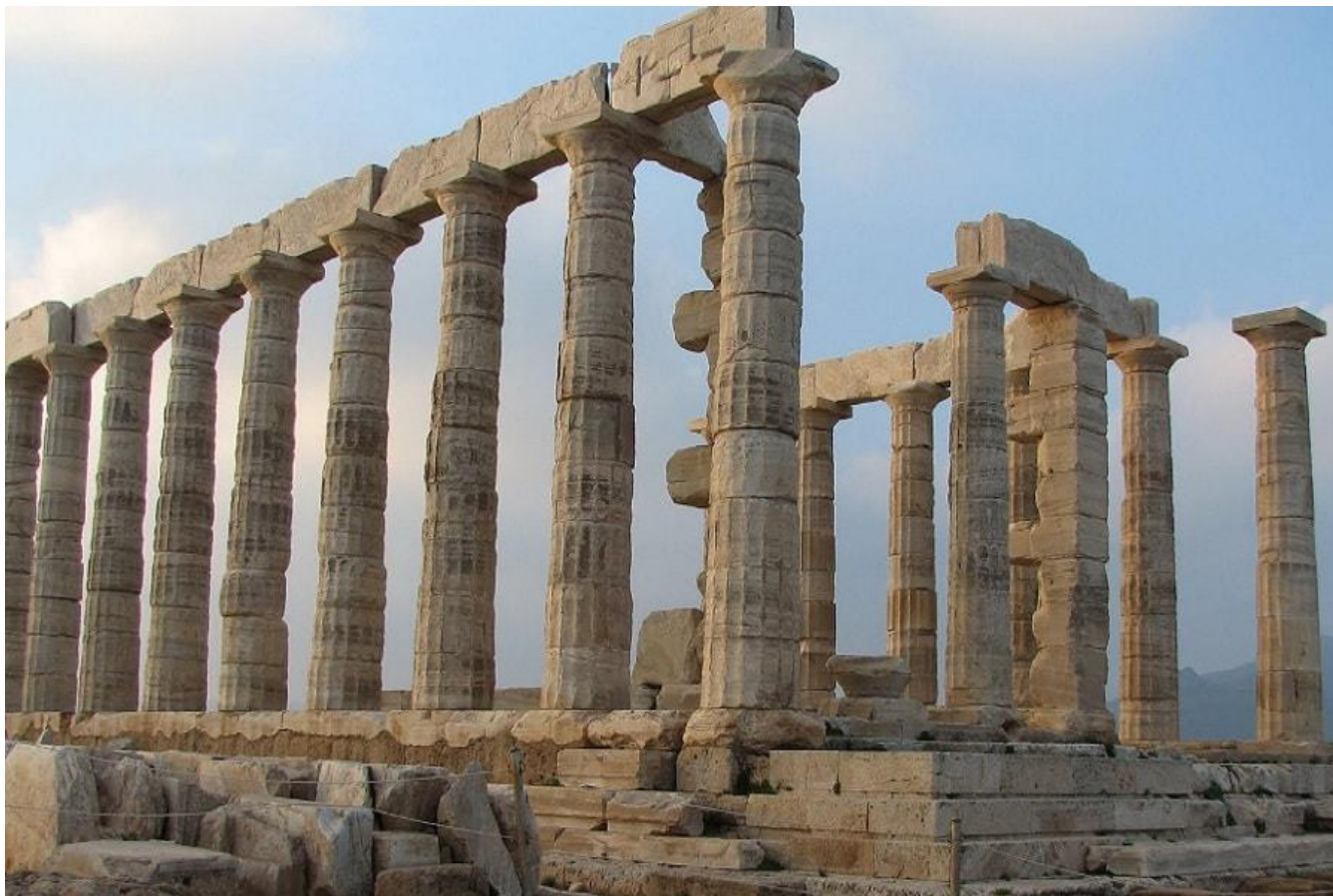
Храм Аполлона в Бассах