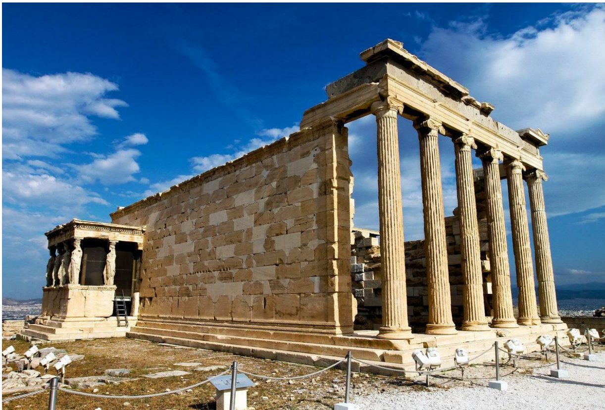
Храм Эрехтейона. Посвящён Афине, Посейдону и легендарному афинскому царю Эрехтею