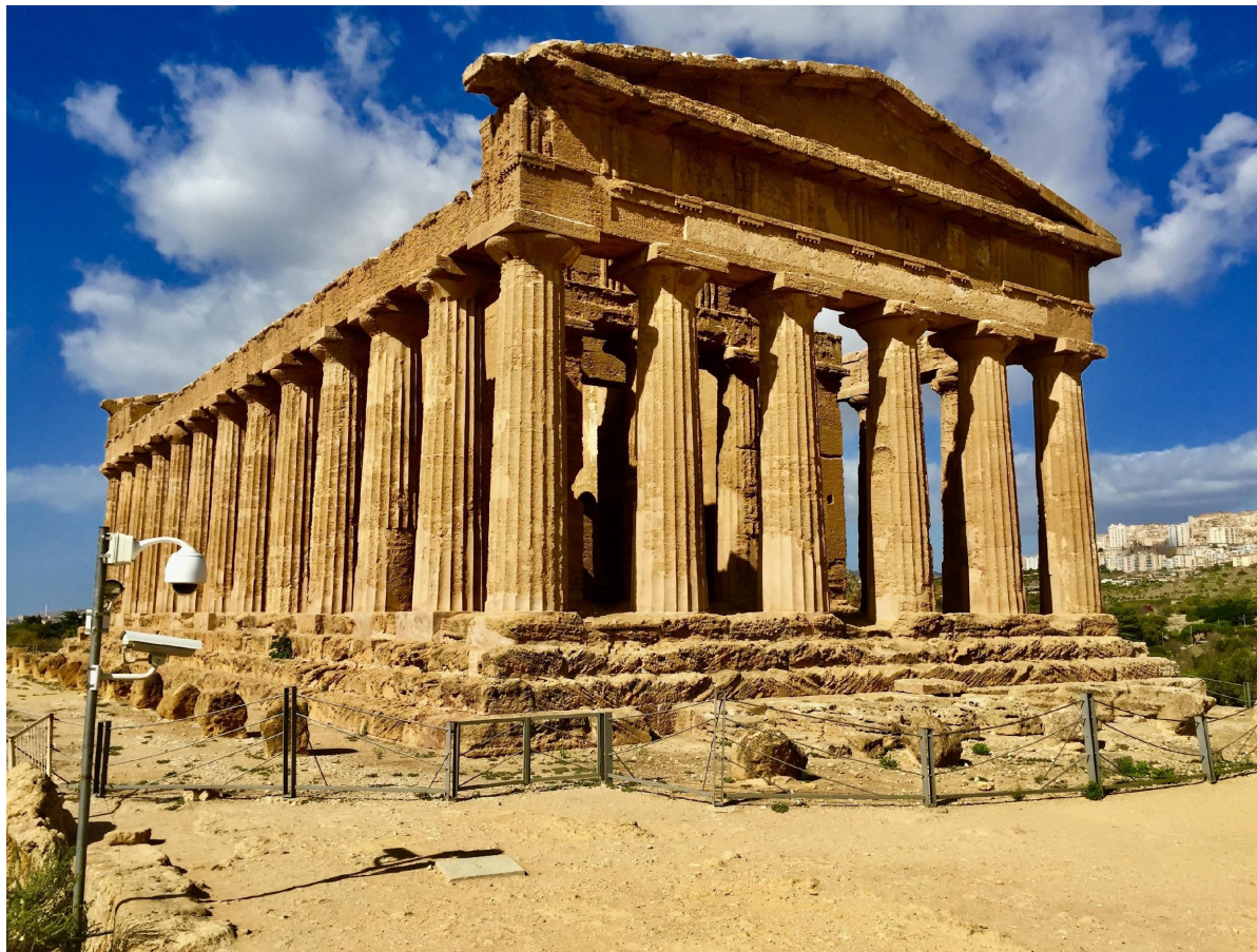
Главный храм Акрополя - Парфенон