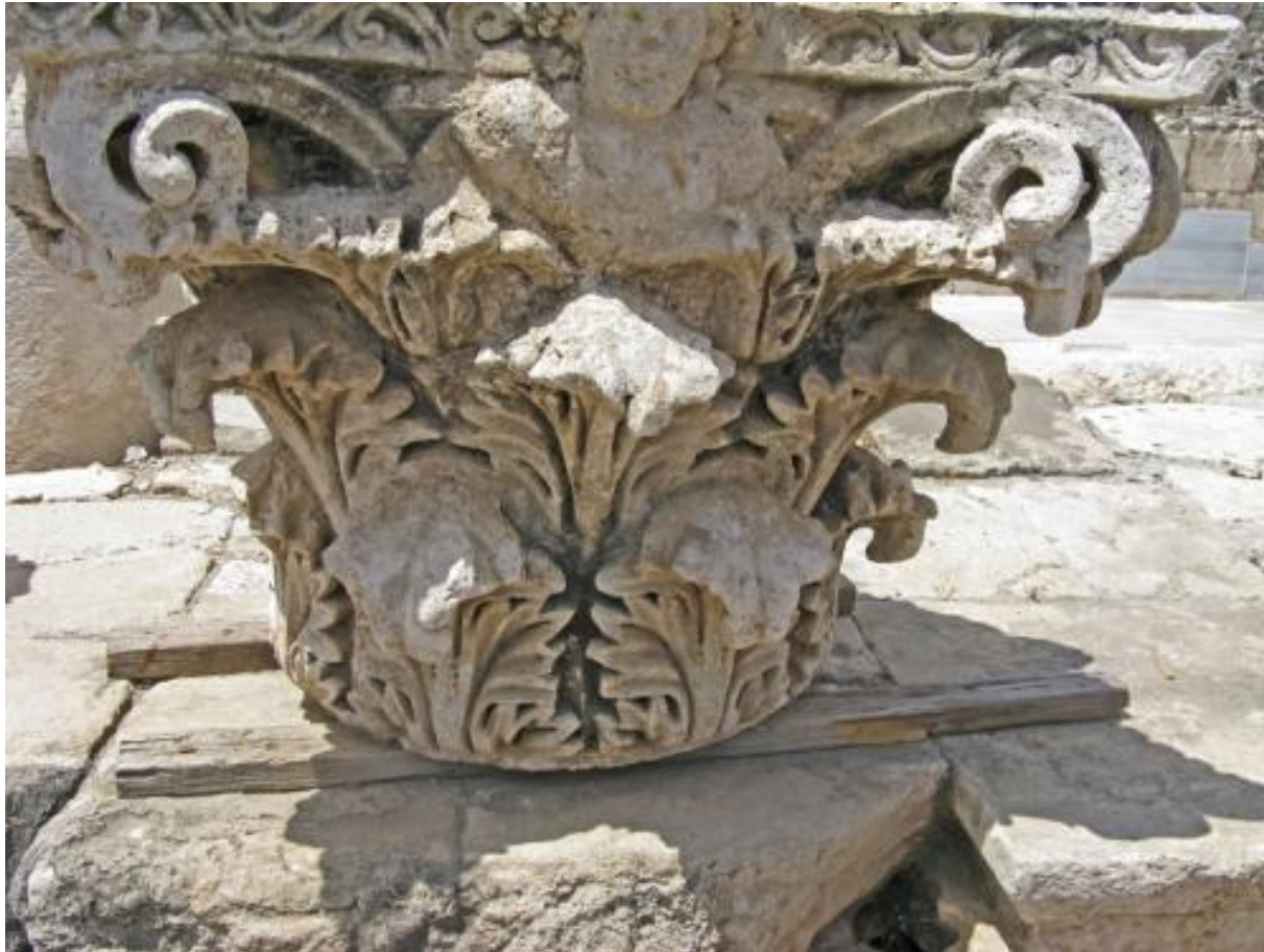
Капитель коринфского ордера