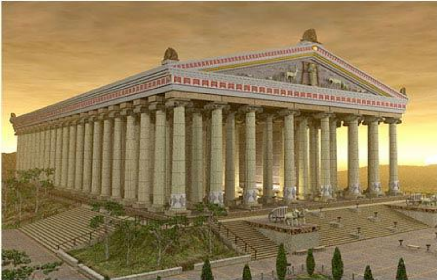
Реконструкция храма Артемиды в Эфесе