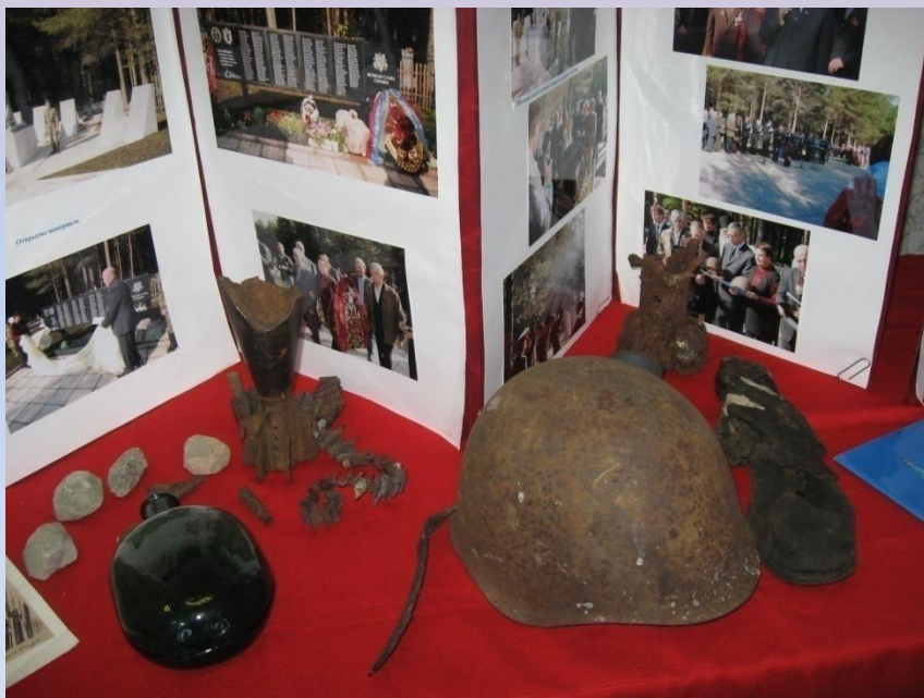
Фото учащихся размещены с согласия родителей

Проект составлен в программе Microsoft Office Power Point 2007, фильм к проекту – Windows Movie Maker