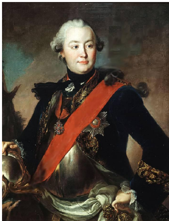
Портрет графа Г.Орлова в латах