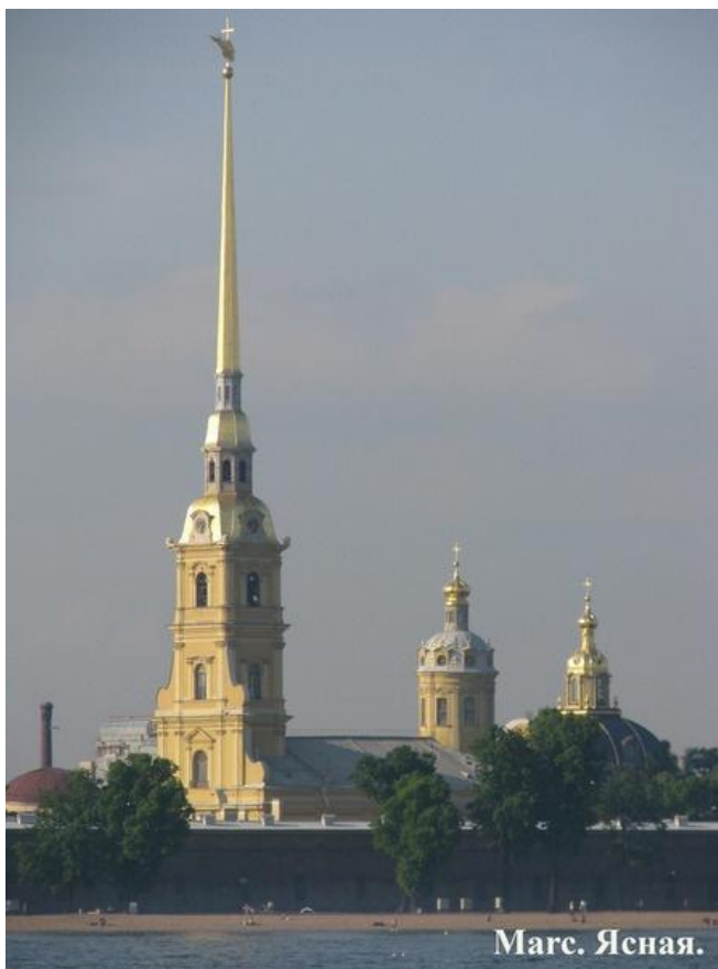
Д.Трезини – Петропавловский собор