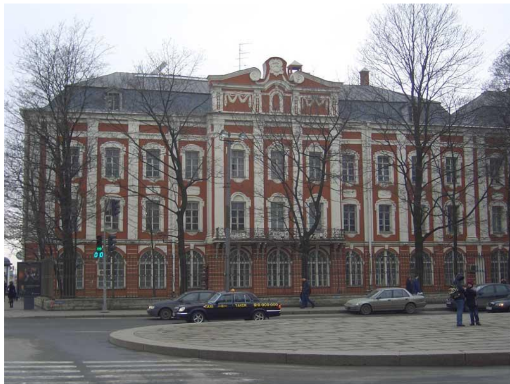
Трезини и Земцов – здание Двенадцати коллегий;