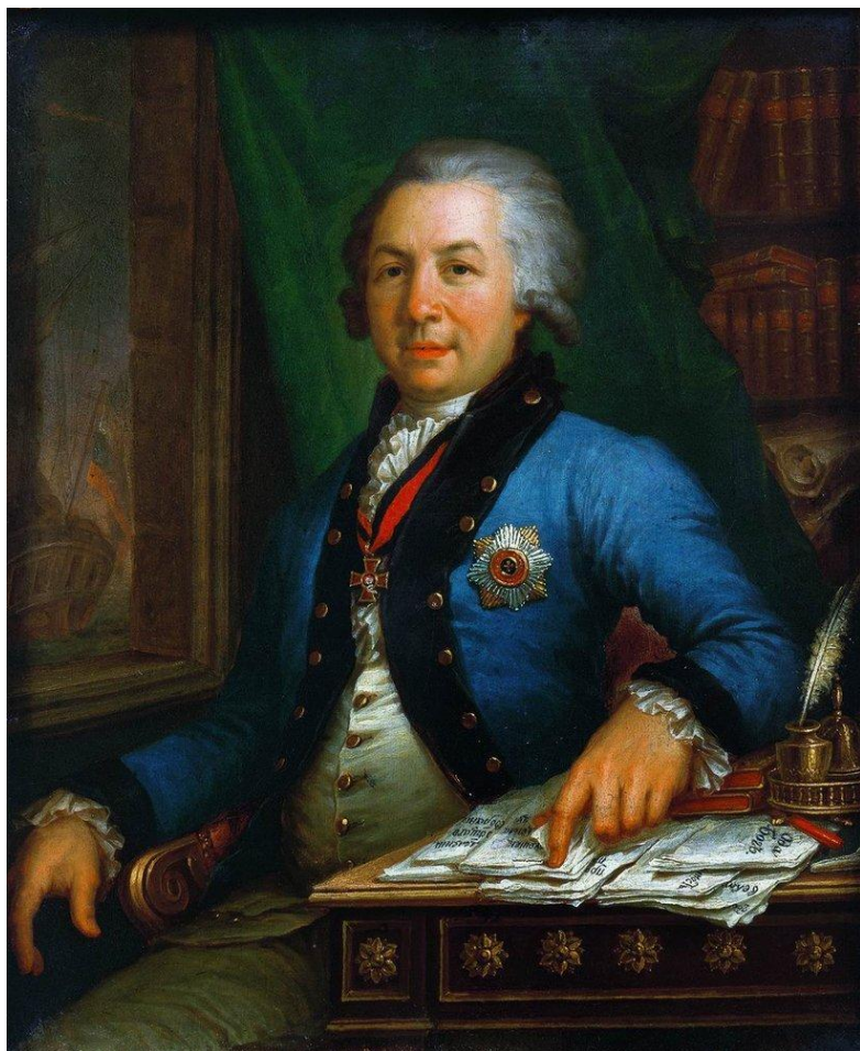
Портрет поэта Г.Р.Державина