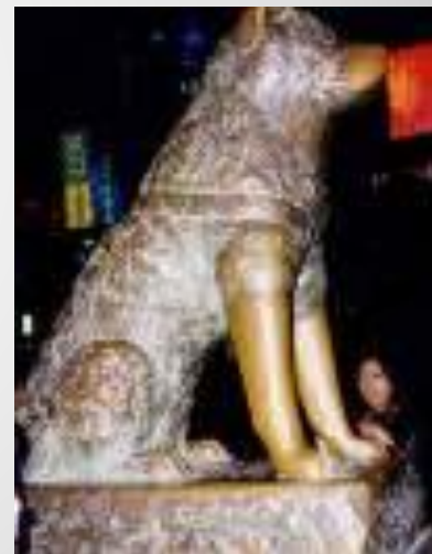
Памятник собаке-поводырю в Берлине.