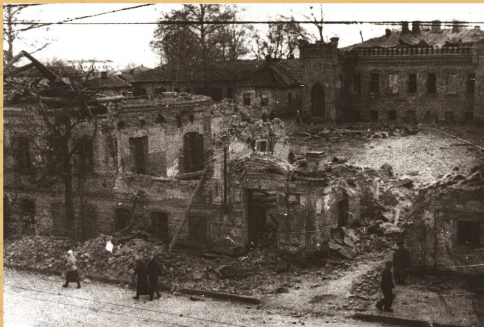
Курск после войны