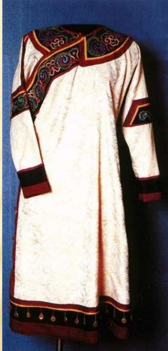
Праздничный нивхский халат