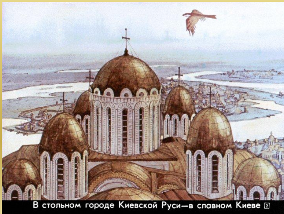
В стольном городе Киевской Руси—в славном Киеве 2

Существует предание об основании Киева. Киев будто бы основал князь Кий, у которого были братья Щек и Хорив и сестра Лыбедь. По их именам были названы холмы Щековица и Хоривица и река Лыбедь.