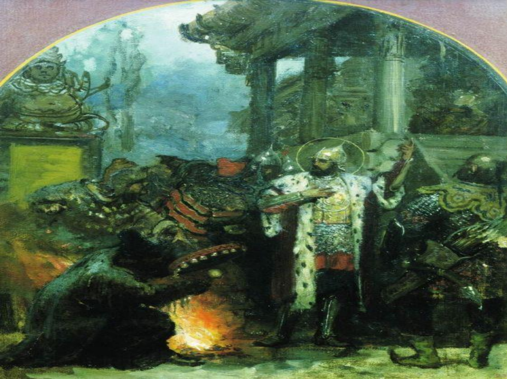
Семирадский Г. И. Александр Невский в Орде. 1876