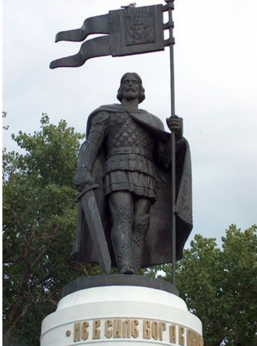
Памятник Великому князю Александру Невскому в Курске, Россия.