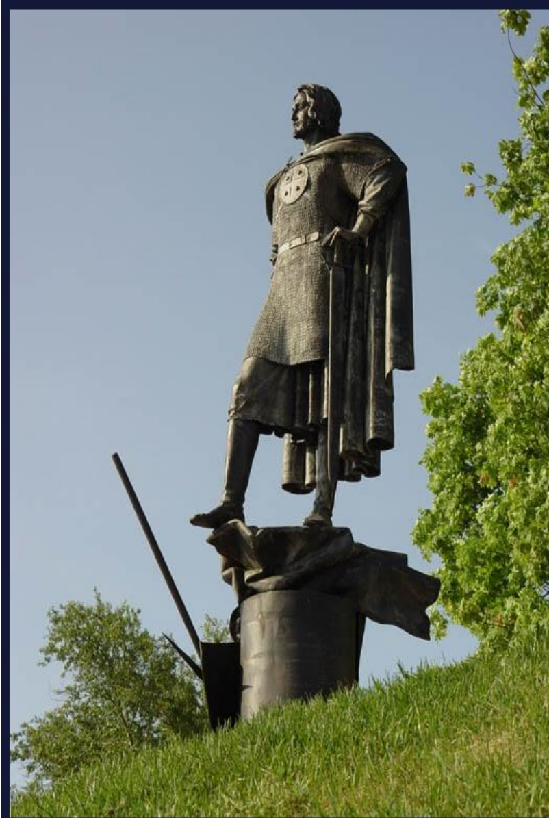
Памятник святого благоверного князя Александра Невского в Усть-Ижоре

Таким образом, связав имя Св. Александра Невского с важнейшей в истории России датой, подписанием мирного договора со шведами, Петр I придал его культу государственный и политический характер. В XIX в. три русских императора были соименны Св. Александру Невскому и тем самым усилилась его роль как покровителя царствующего дома. Последнее во многом предопределило, почему во имя Св. Александра Невского были освящены десятки, если не сотни, церквей, почему многие храмы имели посвященные ему приделы.