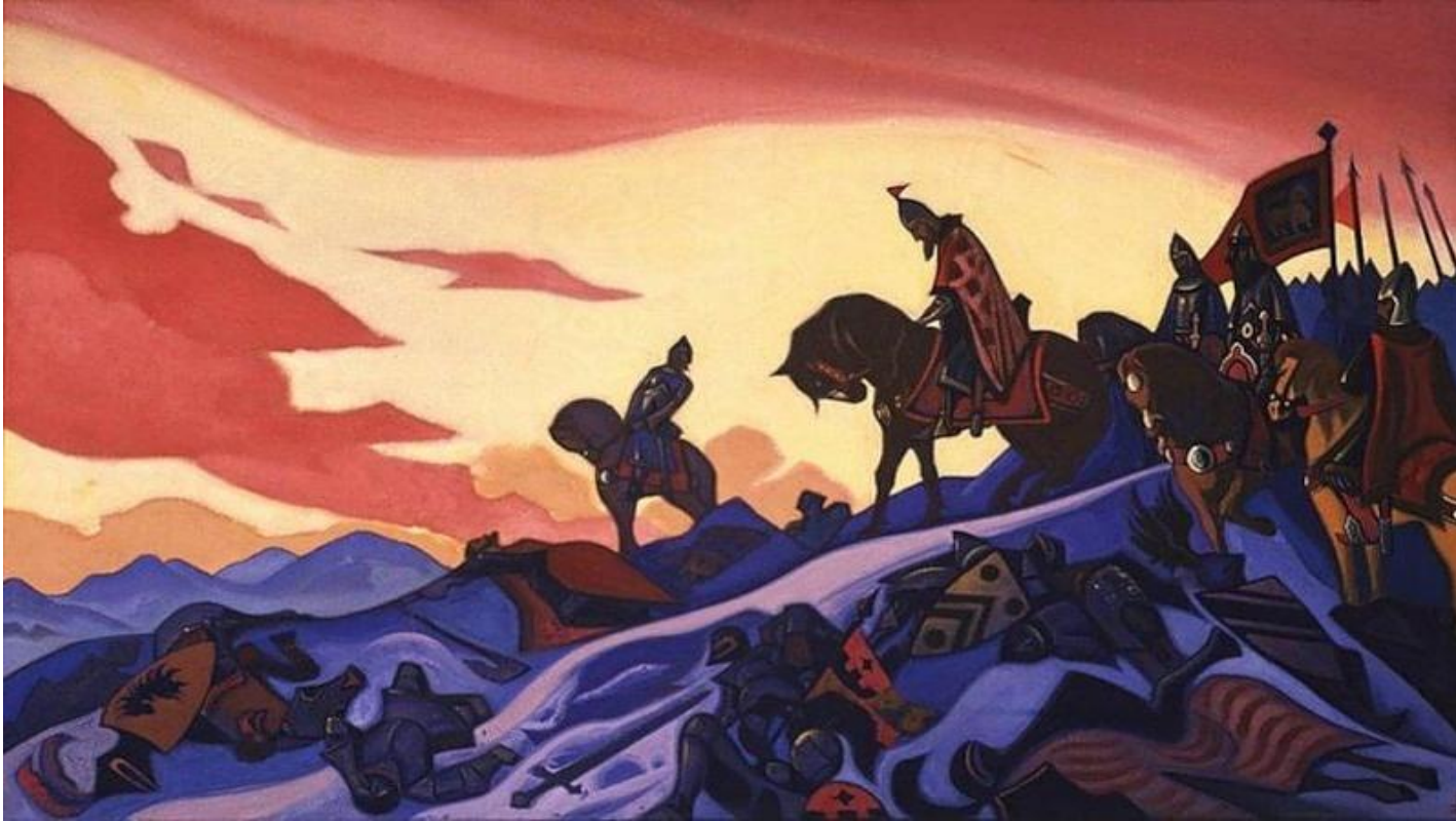
Н.К. Рериха «Русская война (Александр Невский)».

В композиции «Русская война (Александр Невский)» природа хранит следы жестокого сражения. Придерживая коня, князь спускается по крутому заснеженному берегу Чудского озера, усеянного телами побежденных врагов, трупами лошадей, оружием. Полотно звучит одновременно предостережением, выраженным в грозных словах полководца: «Кто с мечом к нам придет - от меча и погибнет», и в то же время воспринимается как свершившийся факт предуказанного неотвратимого Возмездия.