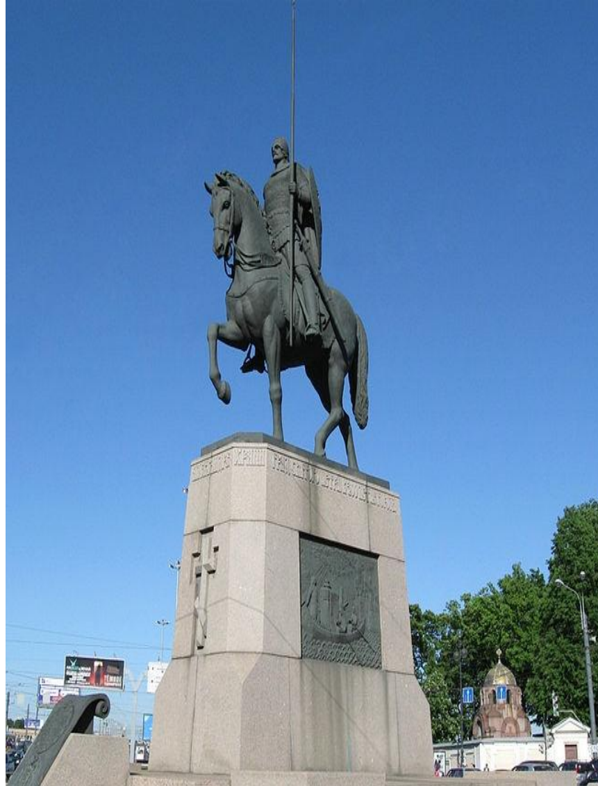
Памятник Александру Невскому в Санкт-Петербурге на площади Александра Невского перед Александро-Невской лаврой

В XVIII—XIX вв. Св. Александр Невский становится одним из наиболее почитаемых в России национальных святых. Превращение Святого Александра Невского в покровителя государства началось в начале XVIII века. Петр I, заложивший новую столицу страны, Санкт-Петербург, на отвоеванных у шведов землях, усмотрел определенный символический смысл в том, что город был основан вблизи места, где в 1240 году новгородский князь Александр Ярославич разгромил тех же шведов. Отныне в небесном покровительстве Св. Александра Невского виделся залог будущей окончательной победы России над ее давним историческим врагом.