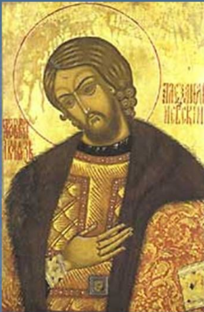
Икона святого благоверного князя Александра Невского