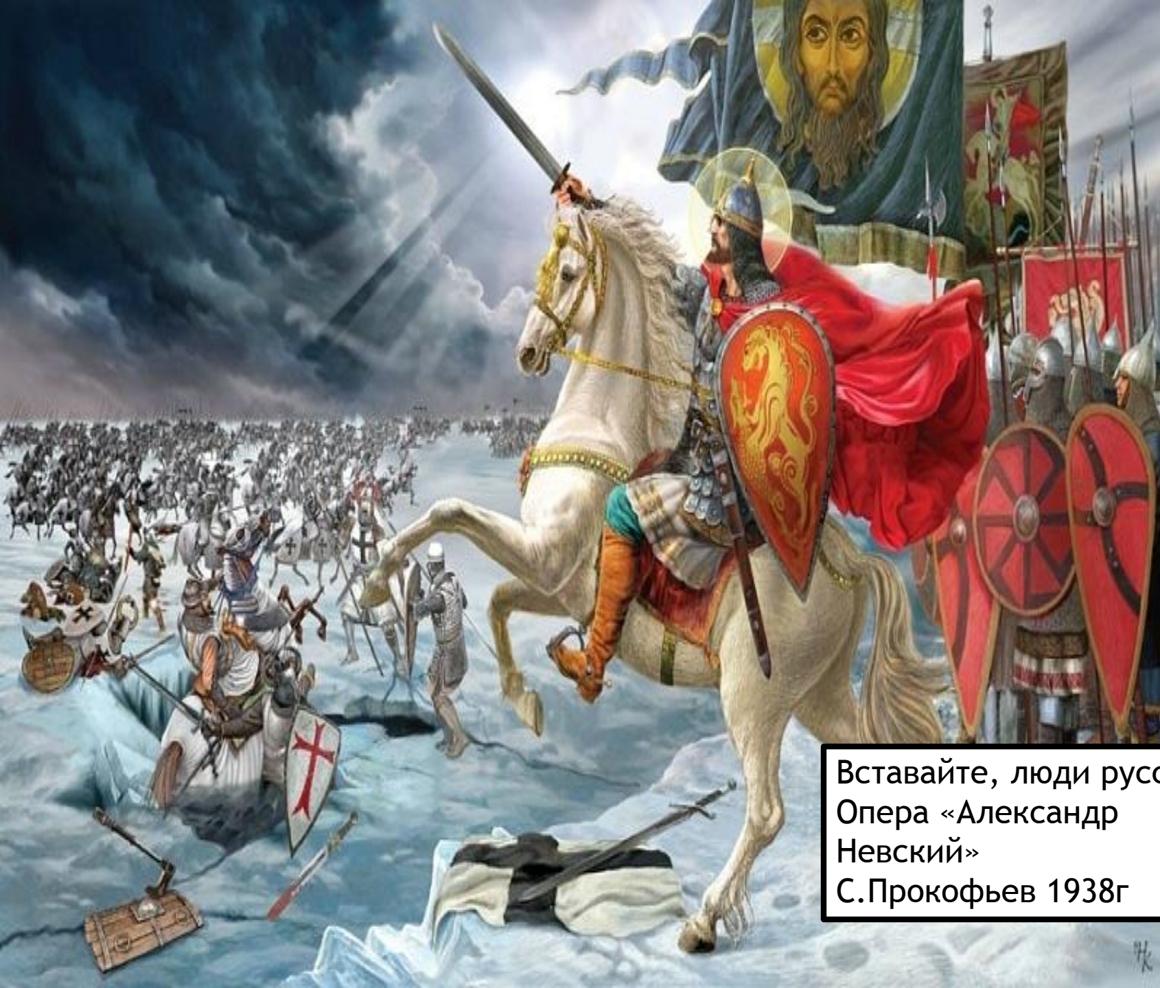
Вставайте, люди русские. Опера «Александр Невский» С.Прокофьев 1938г