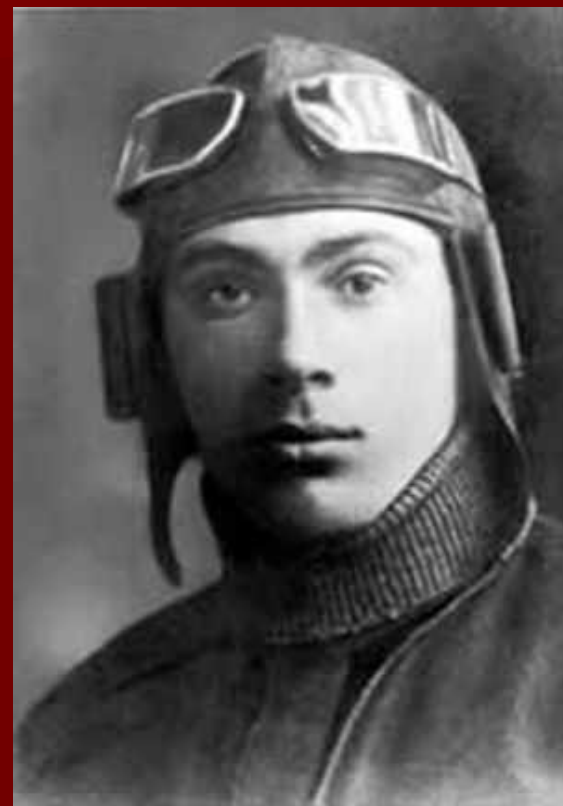
Н. Ф. Гастелло