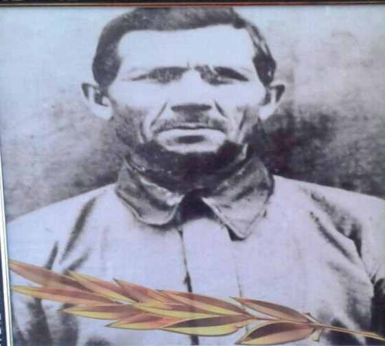
Герой Советского Союза Ломакин А.М.