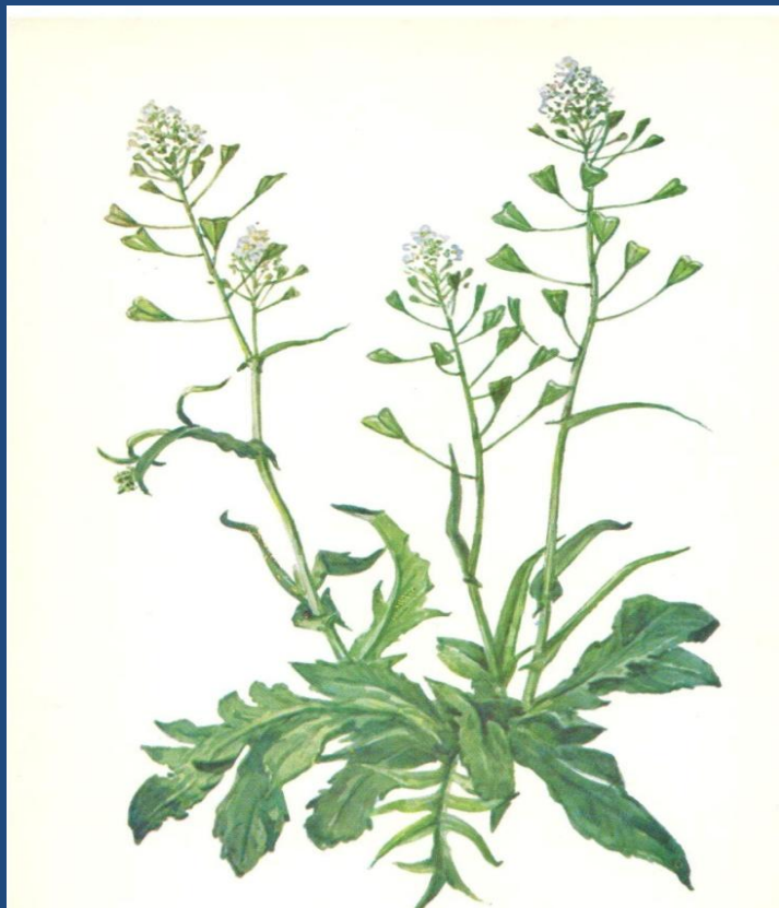
Соцветие Кисть у пастушьей сумки