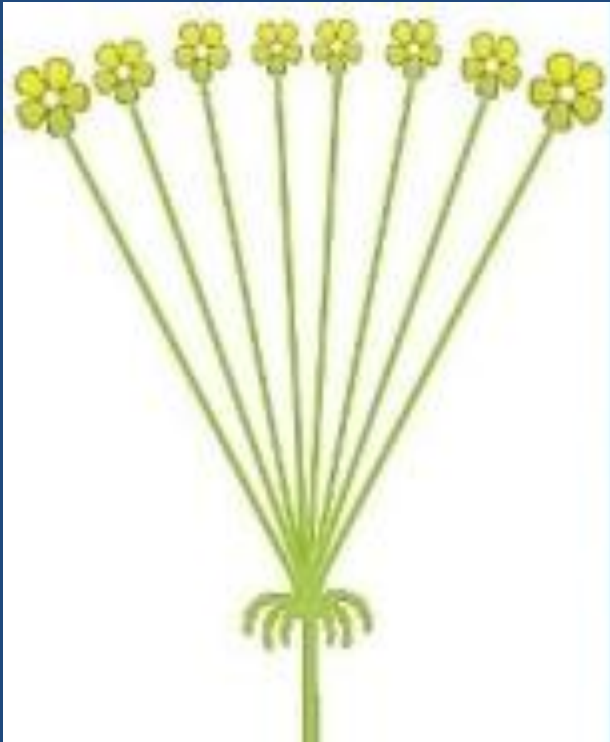
Соцветие Простой зонтик