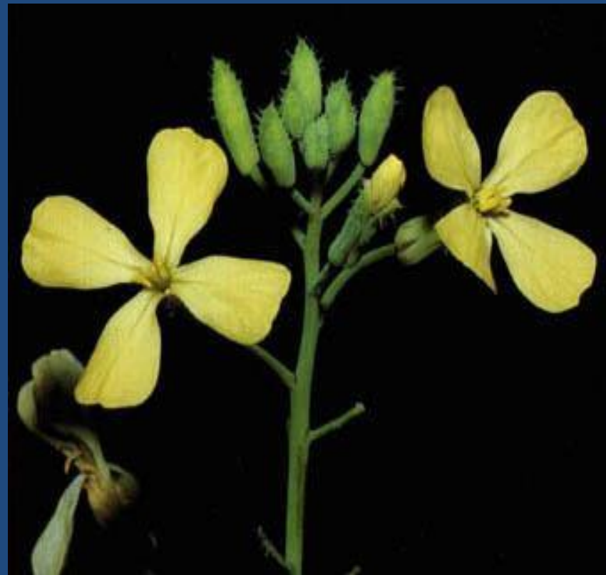
Соцветие Кисть у редьки дикой