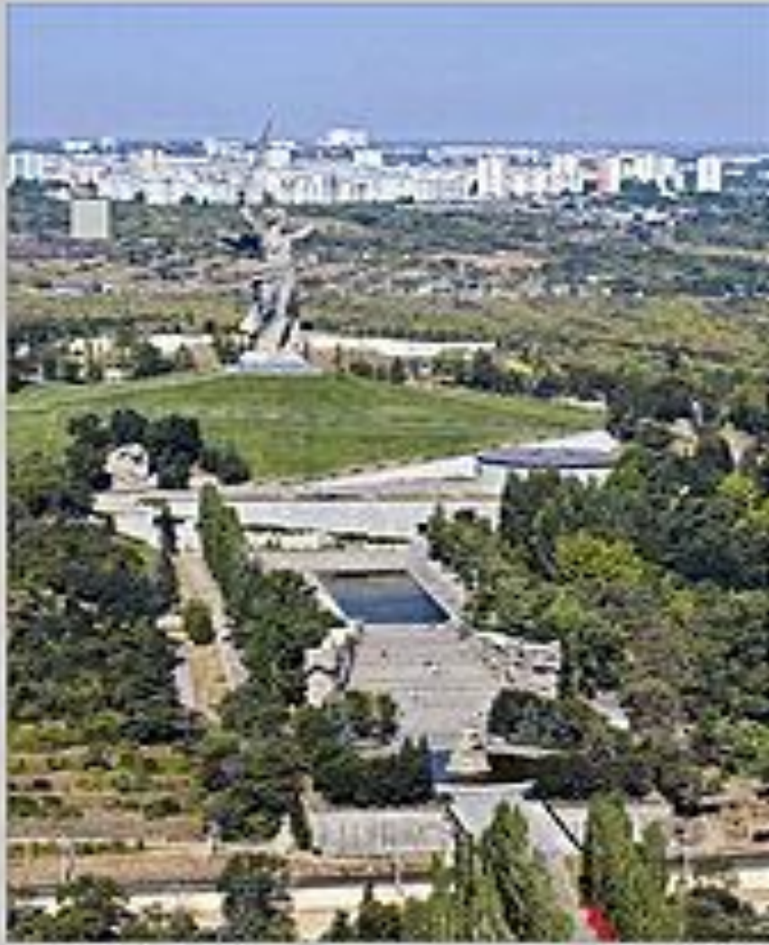
Общий вид на Мамеев Курган