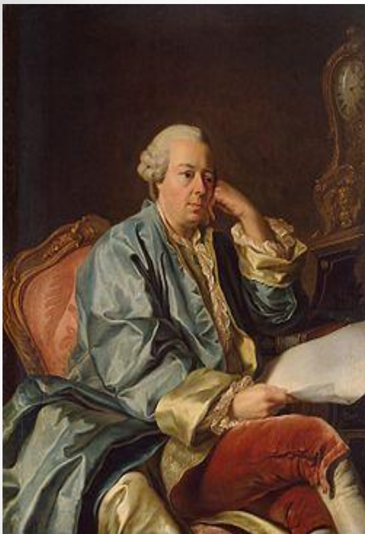
Бецкой Иван Иванович (1704 – 1795) Россия