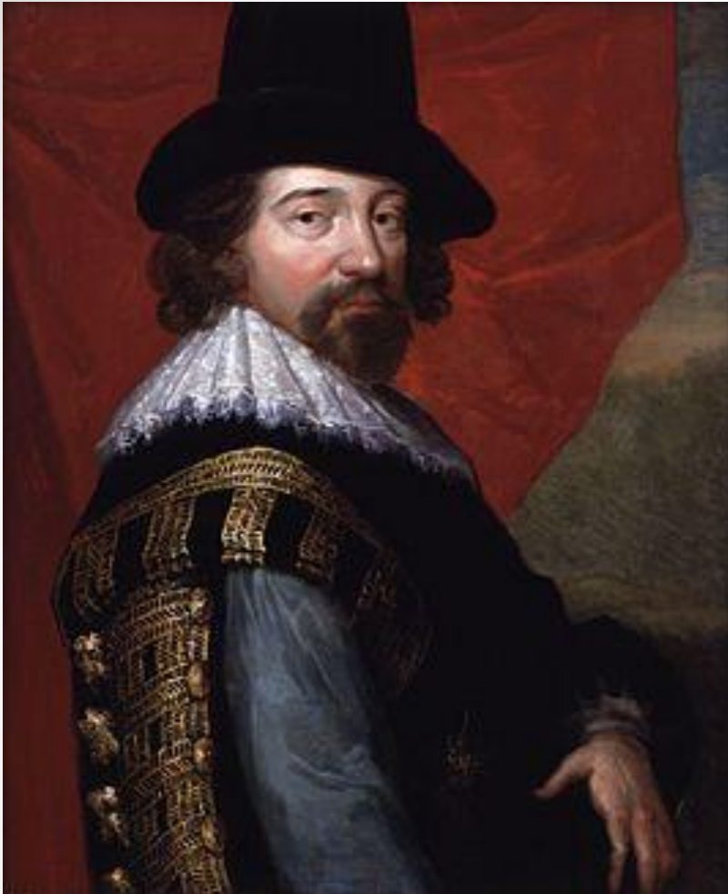
Фрэнсис Бэкон (22.01.1561 – 09.04.1626) Велиобритания

Френсис Бэкон – английский философ – материалист. Суть основной философской идеи Б. – эмпиризма – заключается в том, что в основе познания лежит исключительно опыт. Чем больше опыта, как теоретического, так и практического, накопило человечество (и отдельный человек), тем ближе оно к истинному знанию.