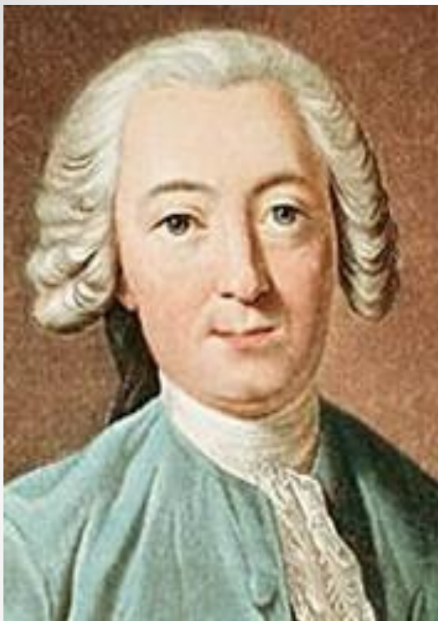
Клод Адриан Гельвеций 31.01.1715 – 26.12.1771 Франц. философ - материалист

Одно из главных сочинений Гельвеция – «Об уме» (1758), которое было издано на русском языке под названием «О человеке, его умственных способностях и его воспитании (М., 1938).