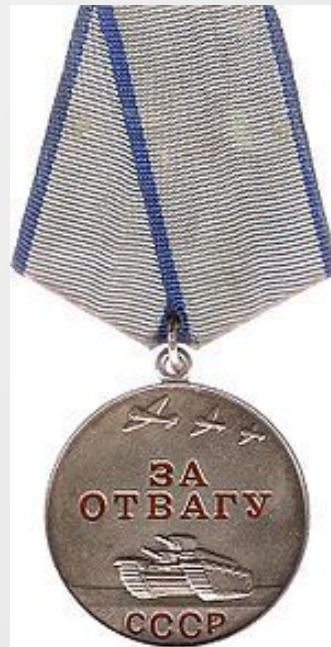
Медаль «За отвагу» (СССР)