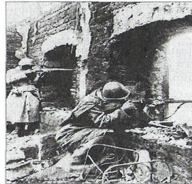
Уличные бои в Мелитополе. Октябрь 1943 года