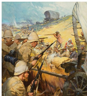
Англо-бурская война 1899 - 1902