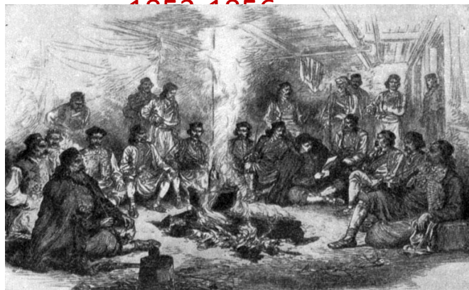
Освободительная борьба Балканских народов