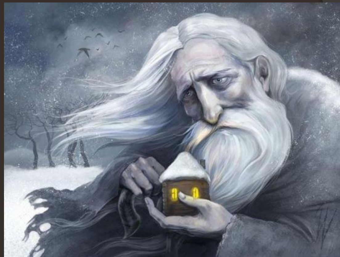
Мудрость в образе старца-основателя или пожилого мужчины