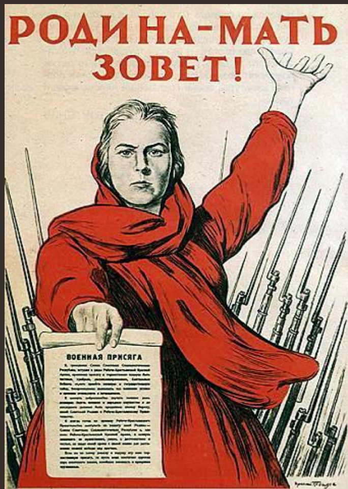
Родина в образе матери

Все наиболее действенные идеалы всегда суть более или менее откровенные варианты архетипа