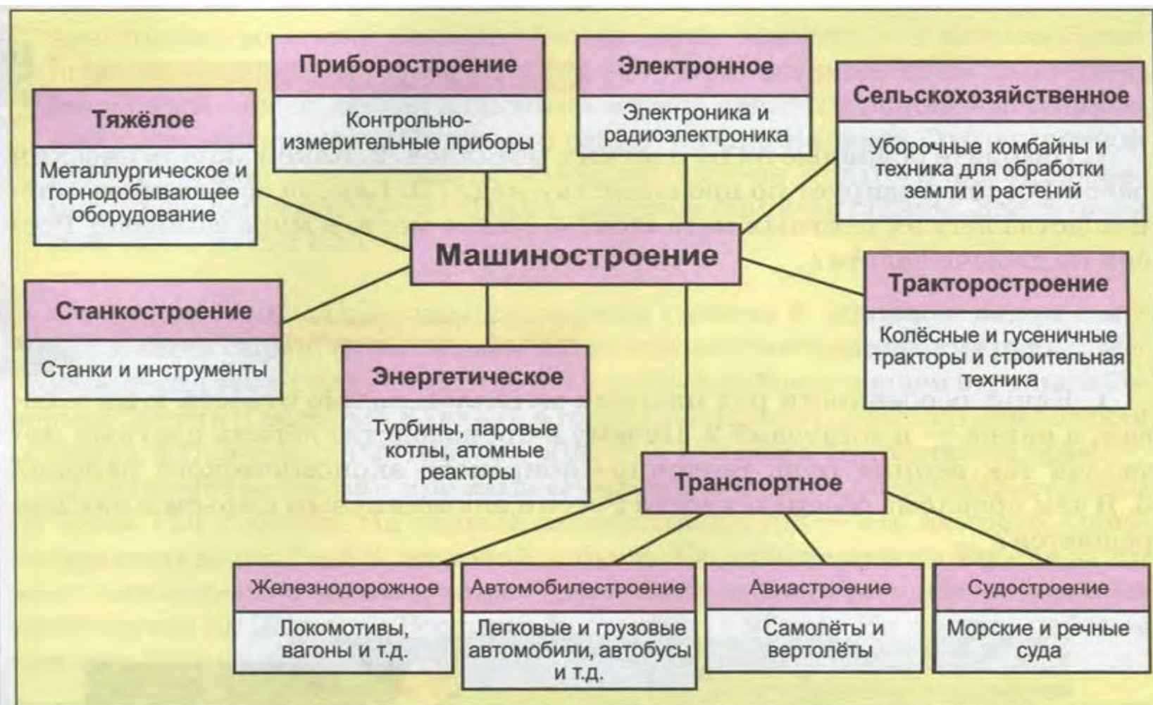
Рис. 62. Отрасли машиностроения