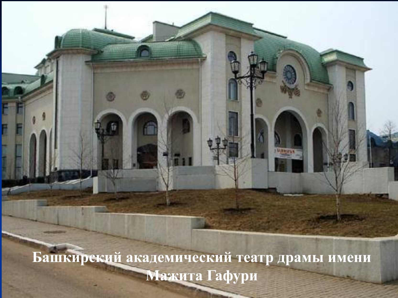
Башкирский академический театр драмы имени Мажита Гафури