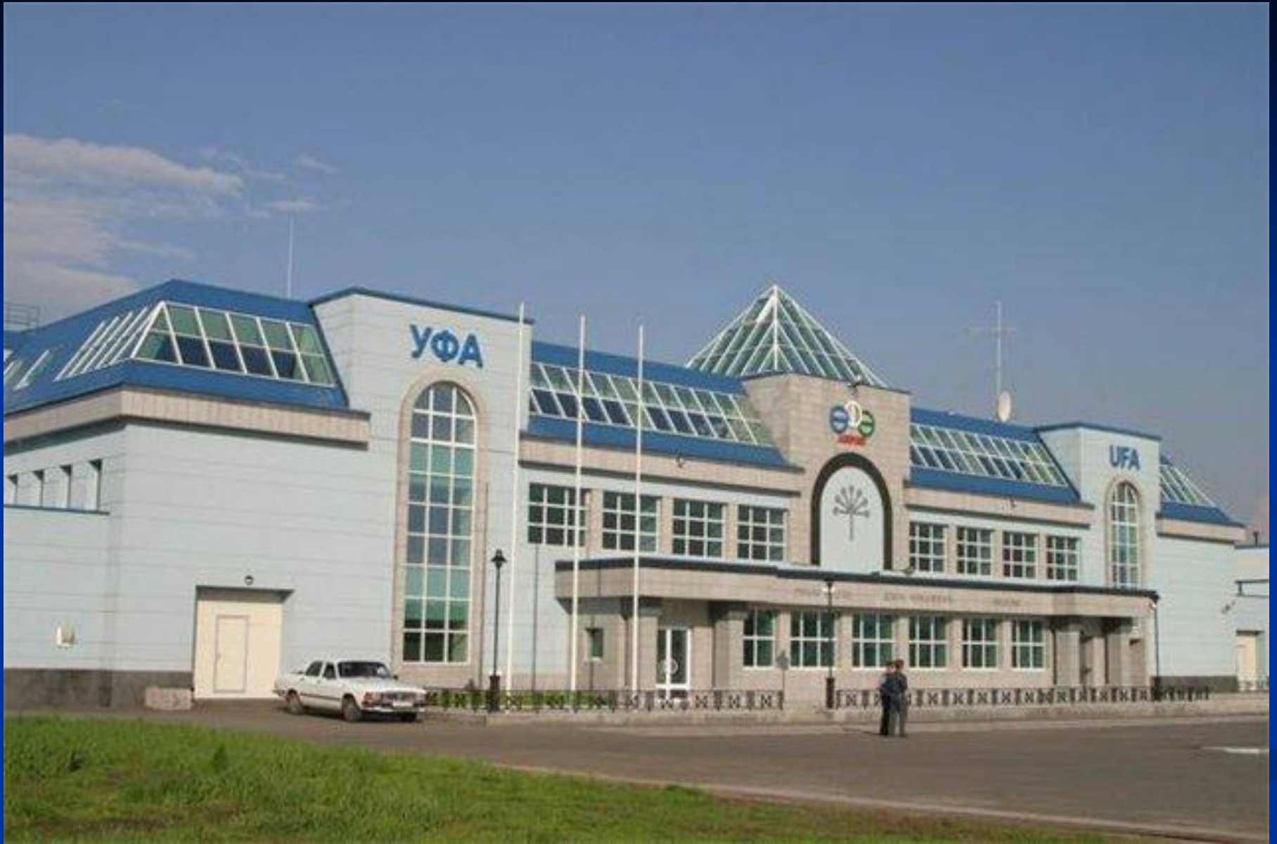
Международный терминал аэропорта "Уфа"