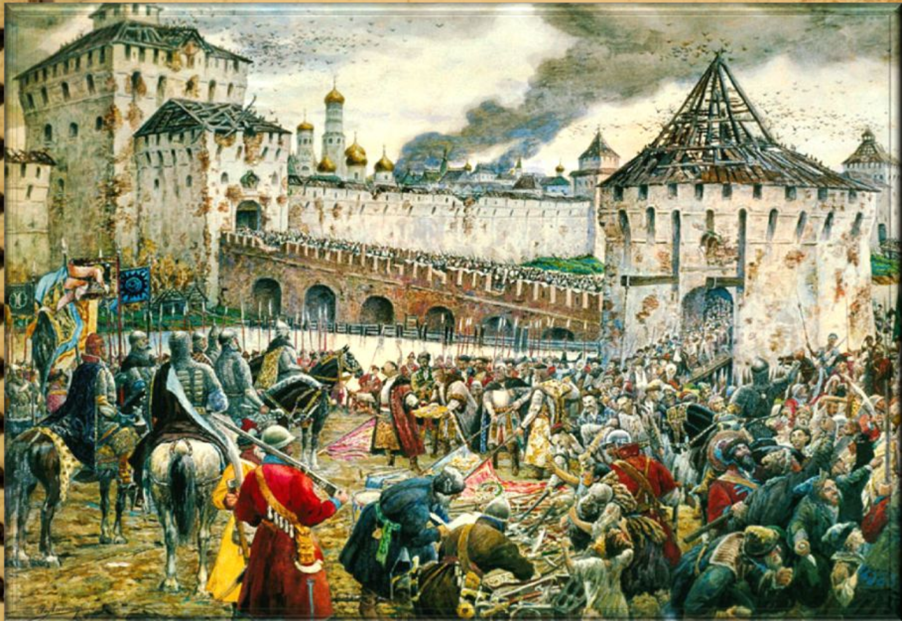
Эрнст Лисснер. «Изгнание польских интервентов из Московского Кремля в 1612 году»