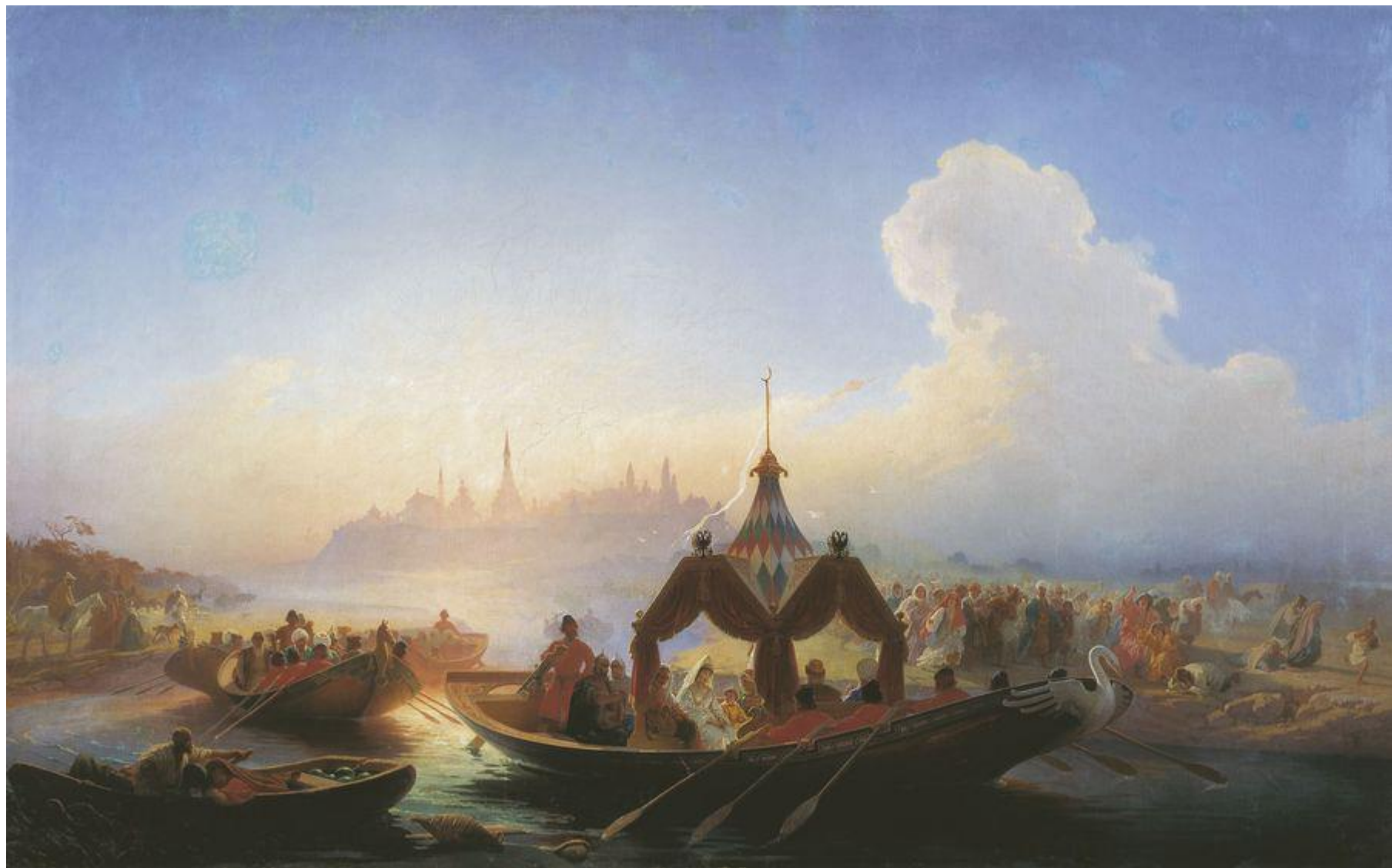
Пленённая царица Сююмбике, покидающая Казань. В. Г. Худяков, 1870.