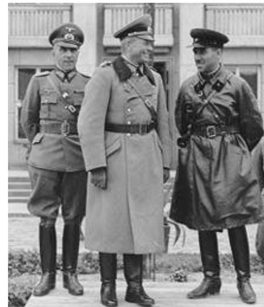
Кривошеин вместе с немецким генералом Гудерианом во время парада 22 сентября 1939 года в Бресте