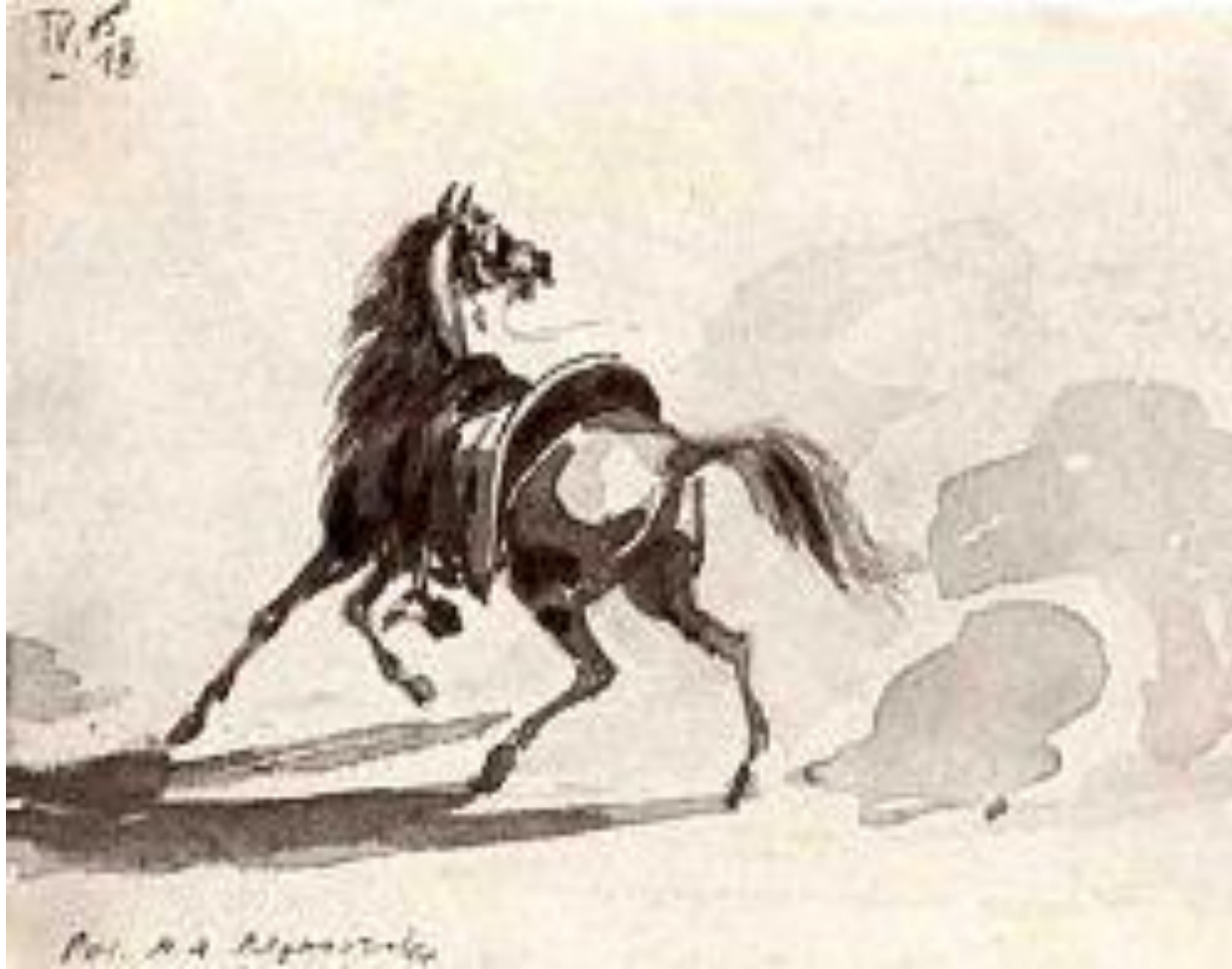
Рисунок Лермонтова М.Ю.

Он рисовал и писал картины маслом, легко решал сложные математические задачи. Был великолепно образован, начитан, слыл сильным шахматистом, владел несколькими иностранными языками.