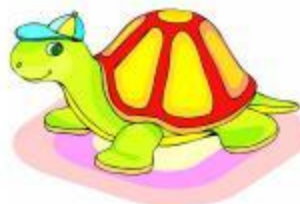
Земноводные и пресмыкающиеся