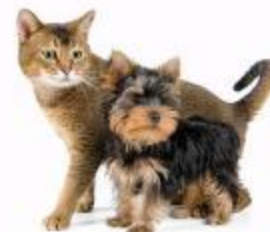
Кошки и собаки